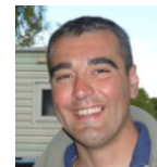
Com on - Blog Javier MERINO