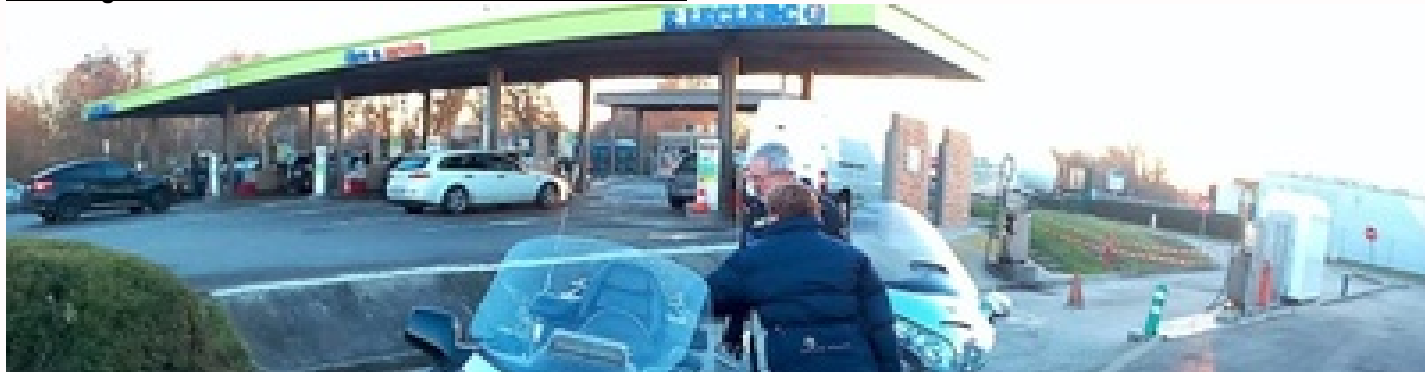
Goldwing - info et services du Unersbande de bikers du 67