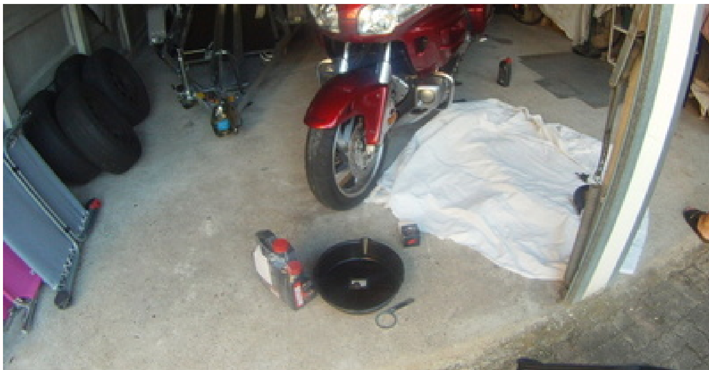
Goldwing - Une goldwing achetée et une vidange effectuée juste avant de partir en vacance