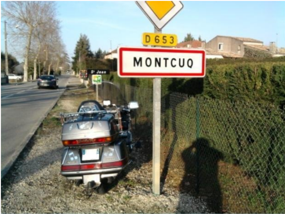
THAT'S ALL LITT