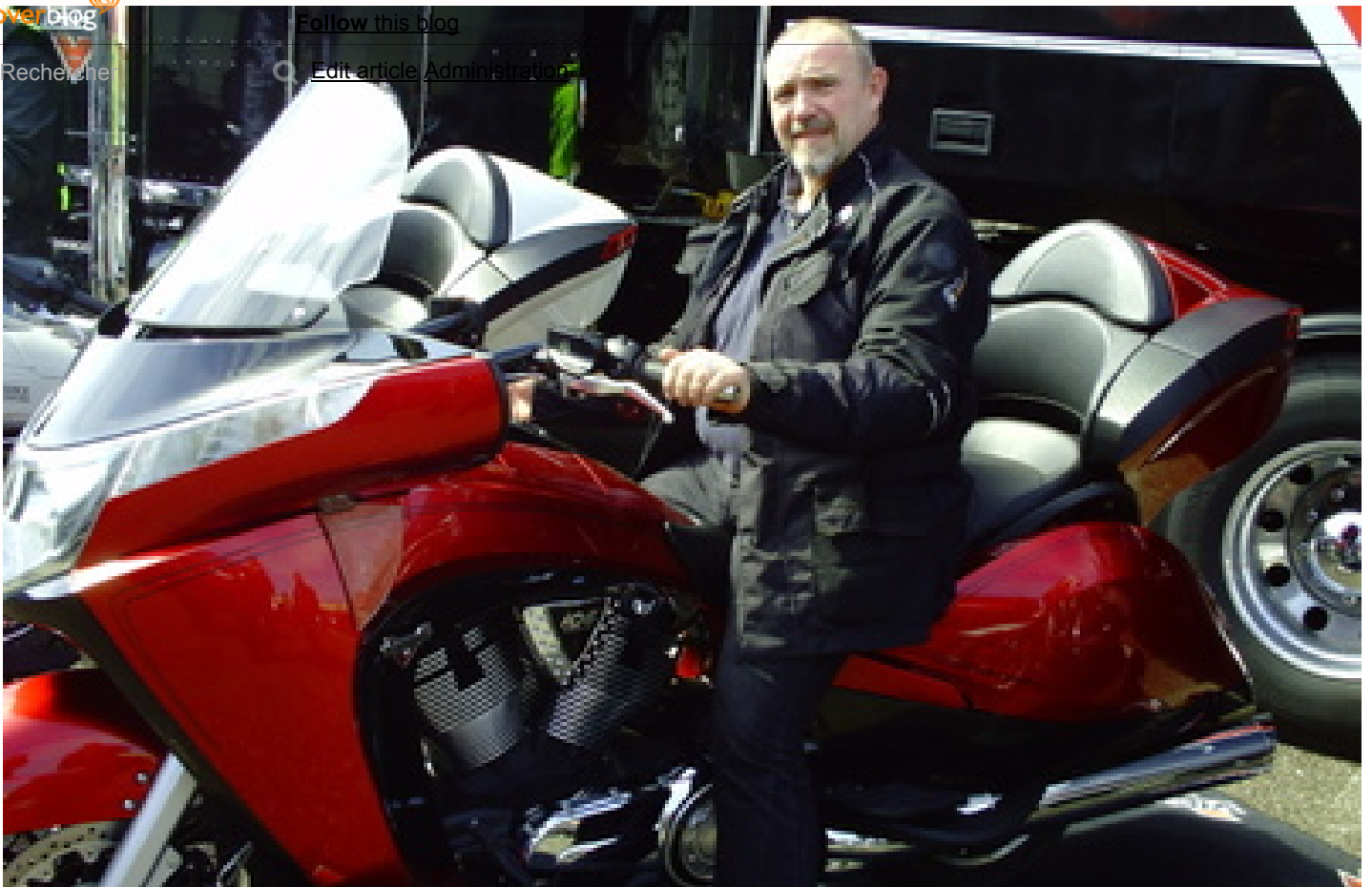
Goldwing - Victory les motos cessent d'exister

Follow this blog Recherche Edit article Administration