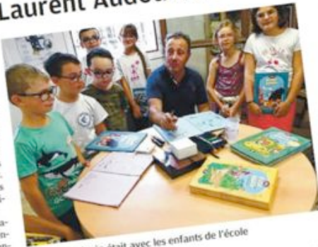
Laurent Audouin était avec les enfants de l'école Paul-Émile-Victor, mardi.

L aurent Audouin est un artiste célèbre d'illustrations qui, depuis trente ans, passe son temps à crayonner, dessiner et à colorier ses dessins. En amont du festival de polar Noir Dissay prévu la semaine du 19 au 24 septembre, il est venu mardi 13 septembre animer des ateliers de dessins dans trois classes de l'école Paul-Émile-Victor. En soirée, il a dédié ses livres à la médiathèque municipale. Laurent Audouin est le créateur de nombreux personnages : Victor, Adèle ou encore Sacré-Cœur, un écolier sympathique féru d'enquêtes et de mystères qui parcourt les musées et lieux à la mode du Paris de la Belle Époque. À chaque page, la précision et la minutie des traits et des couleurs