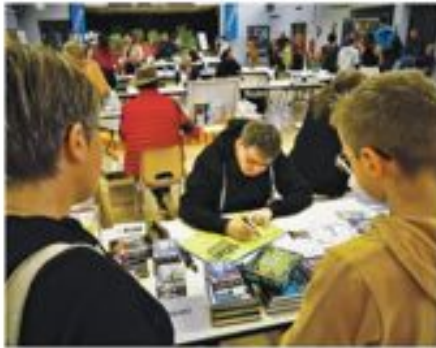
La quinzaine d'auteurs a joué le jeu des dédicaces.