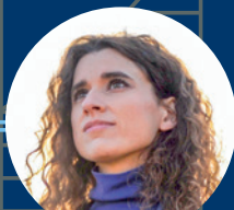
Morgan of Glencoe