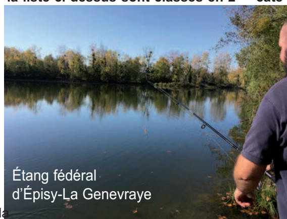
Étang fédéral d'Épisy-La Genevraye