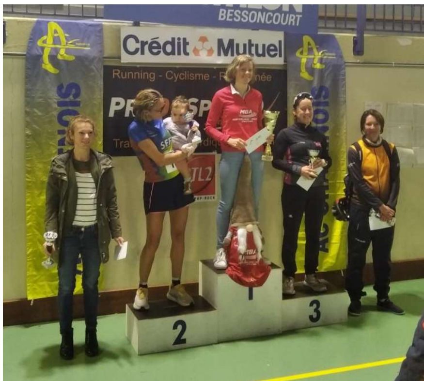
Remise des récompenses Femmes