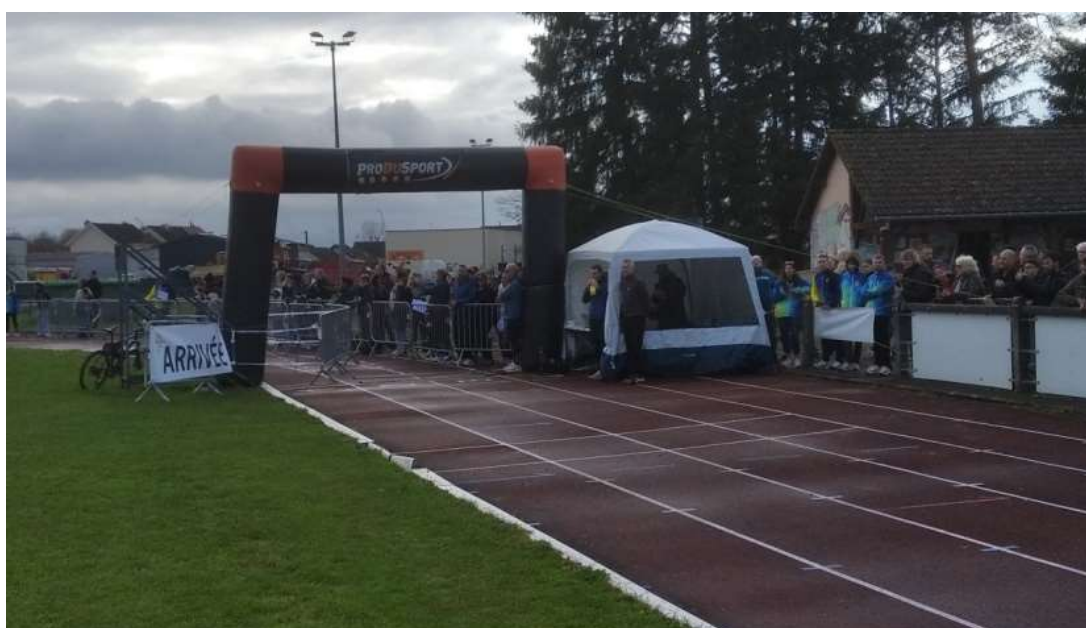
Arrivée piste du stade