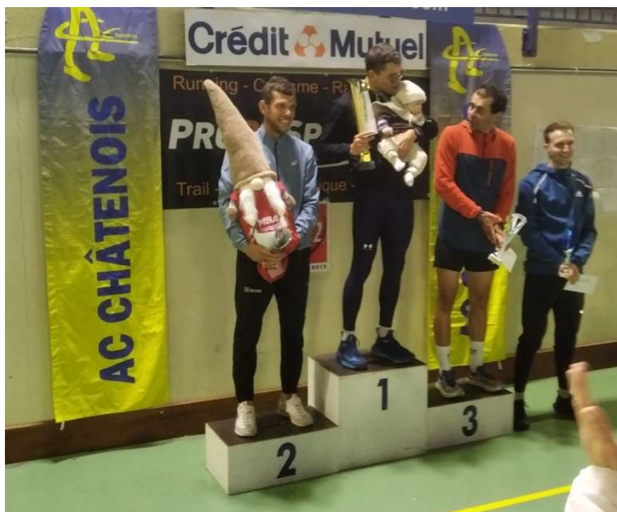
Remise des récompenses Hommes