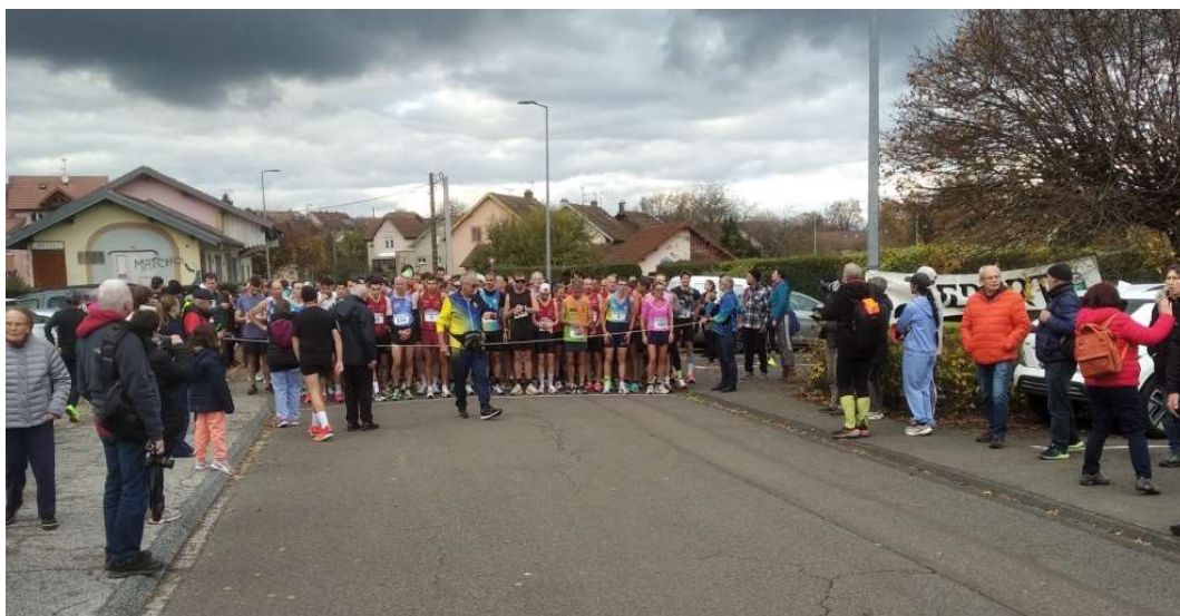
Départ voie du Tram