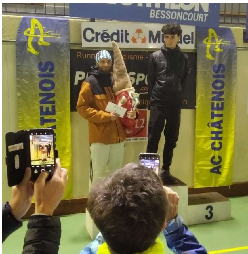
Remise des récompenses Homme