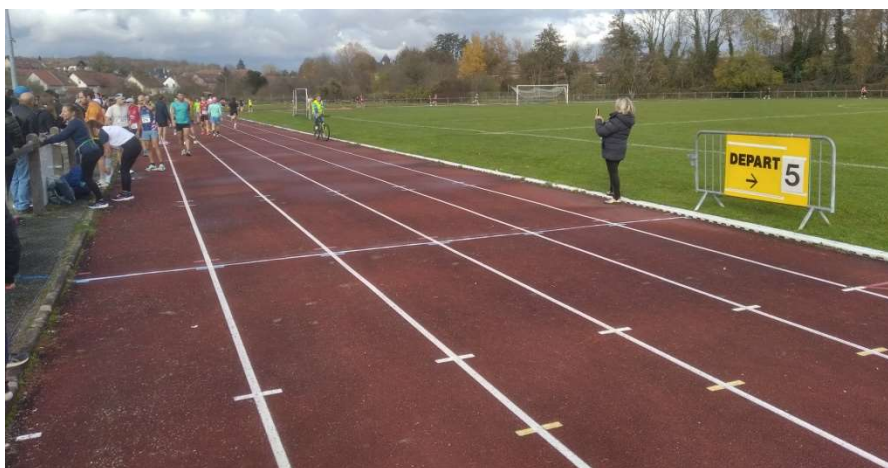
Départ Piste du stade