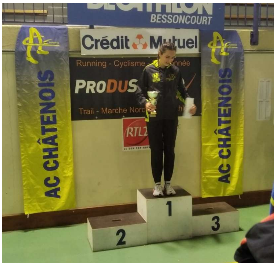
Remise des récompenses Femme