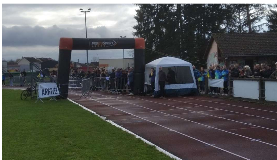
Arrivée Piste du stade