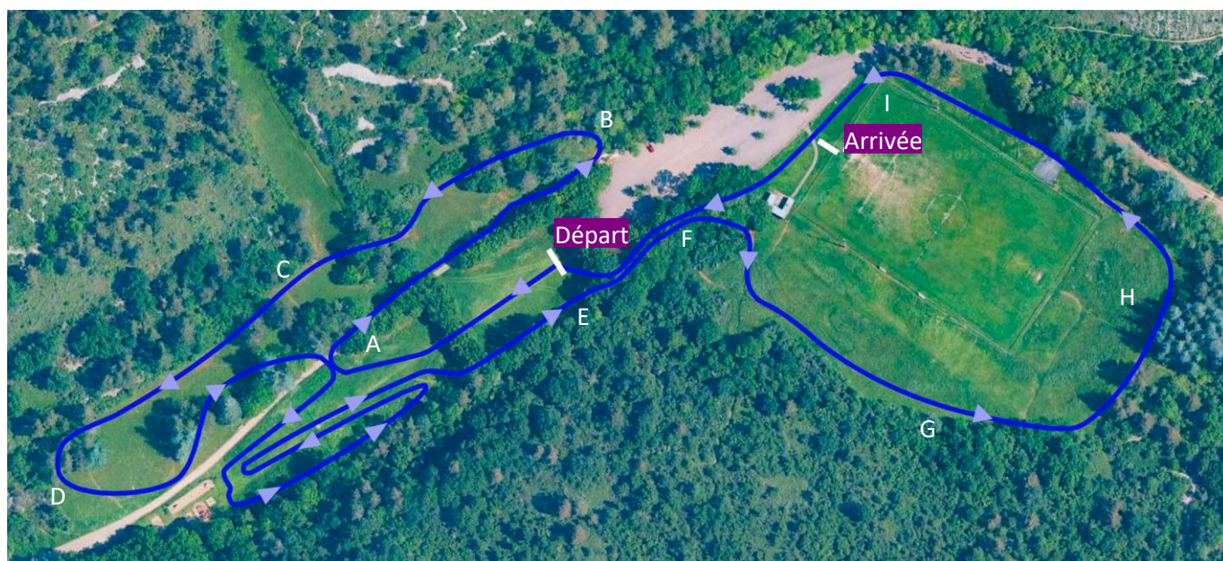
Grande Boucle 1900m ABCDEFGHI

Caractéristiques du terrain : Herbeux avec traversée de route (5m protégé par tapis)