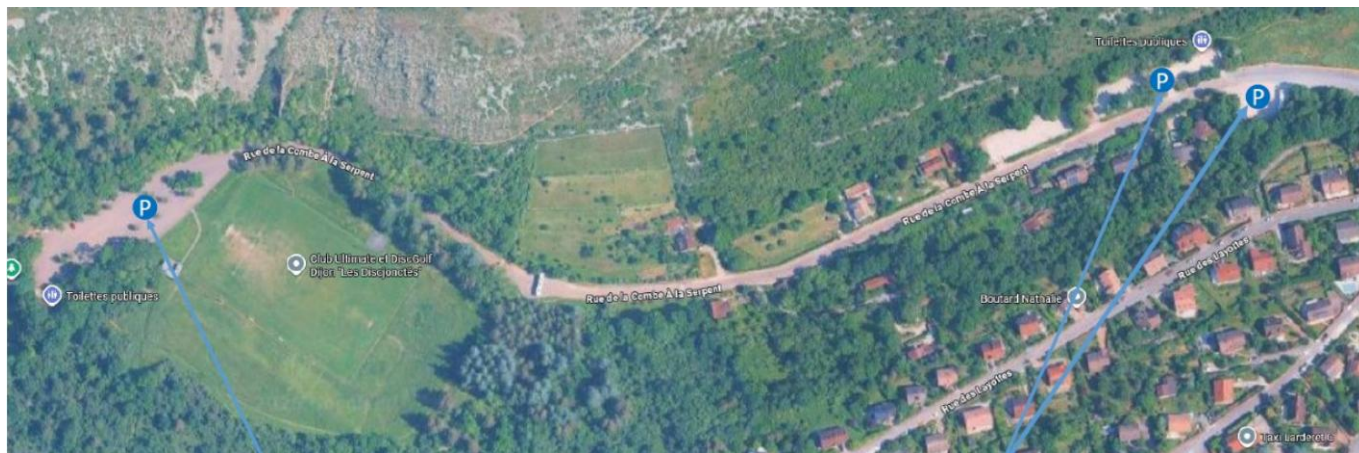
Parking : Voitures / minibus sur site <1m90