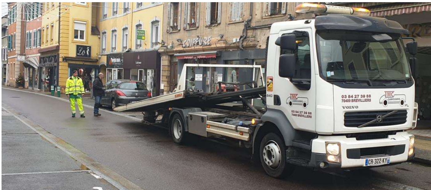
Un parcours parfaitement sécurisé – Enlèvement des véhicules gênants