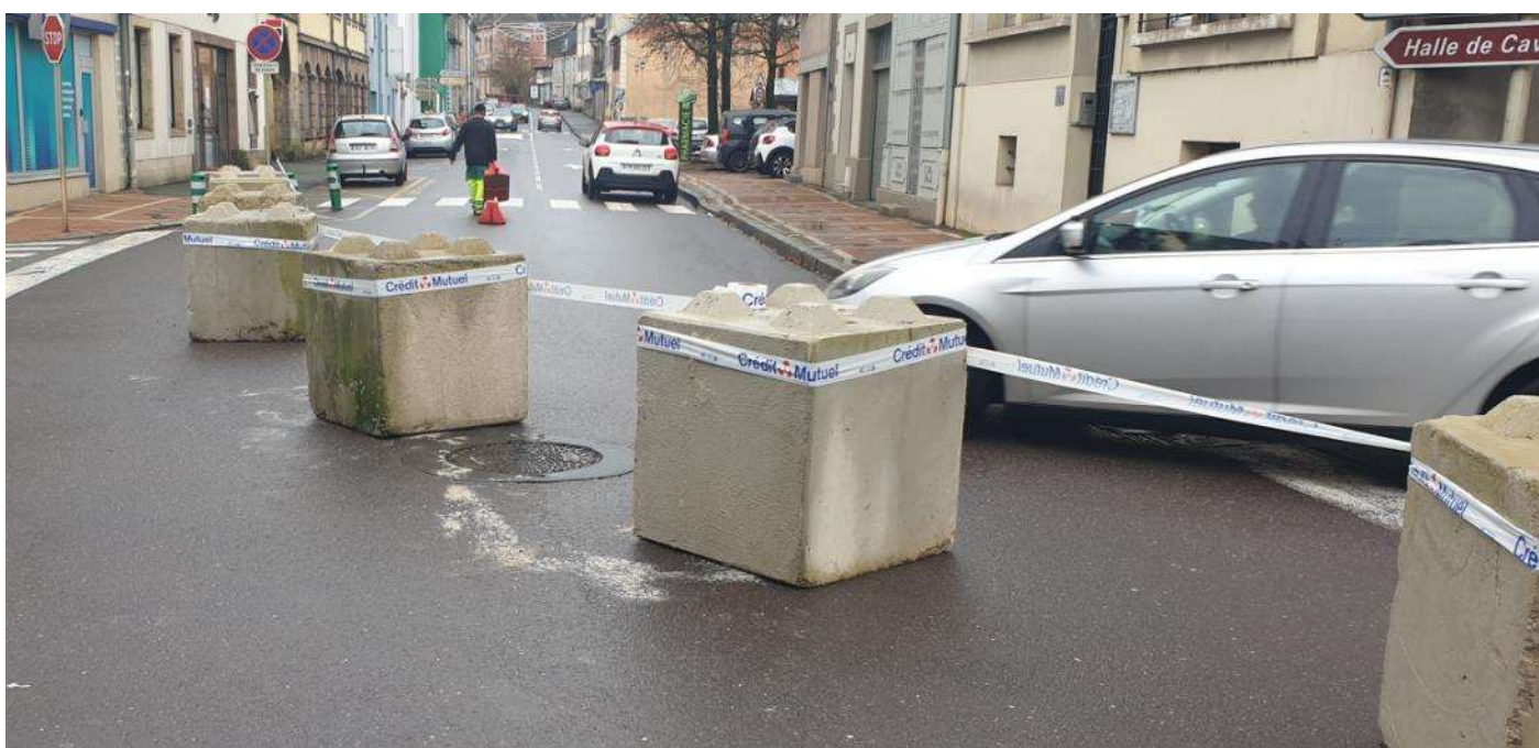
Un parcours parfaitement sécurisé – blocs de sécurité