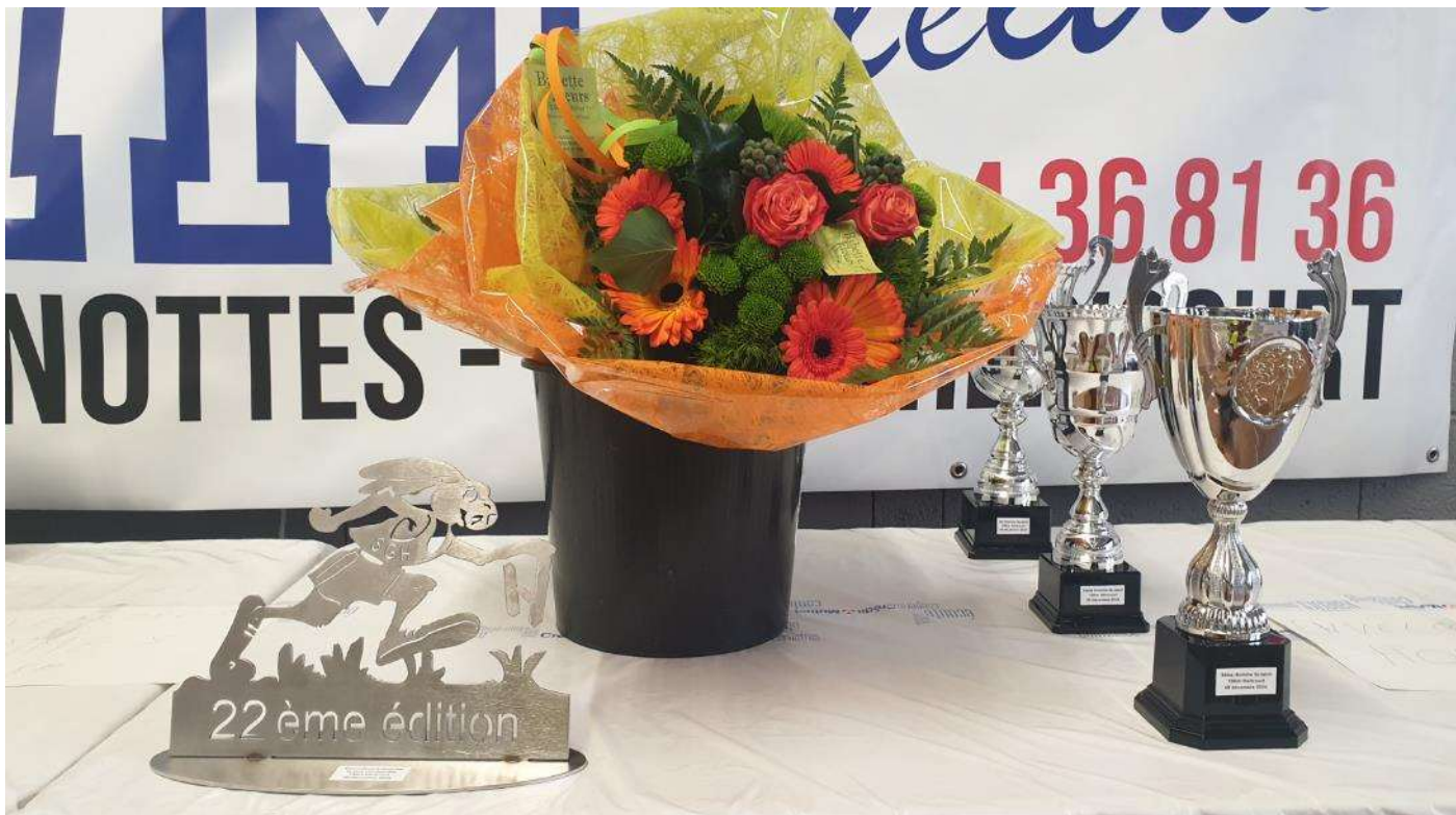
Une remise des prix réussie