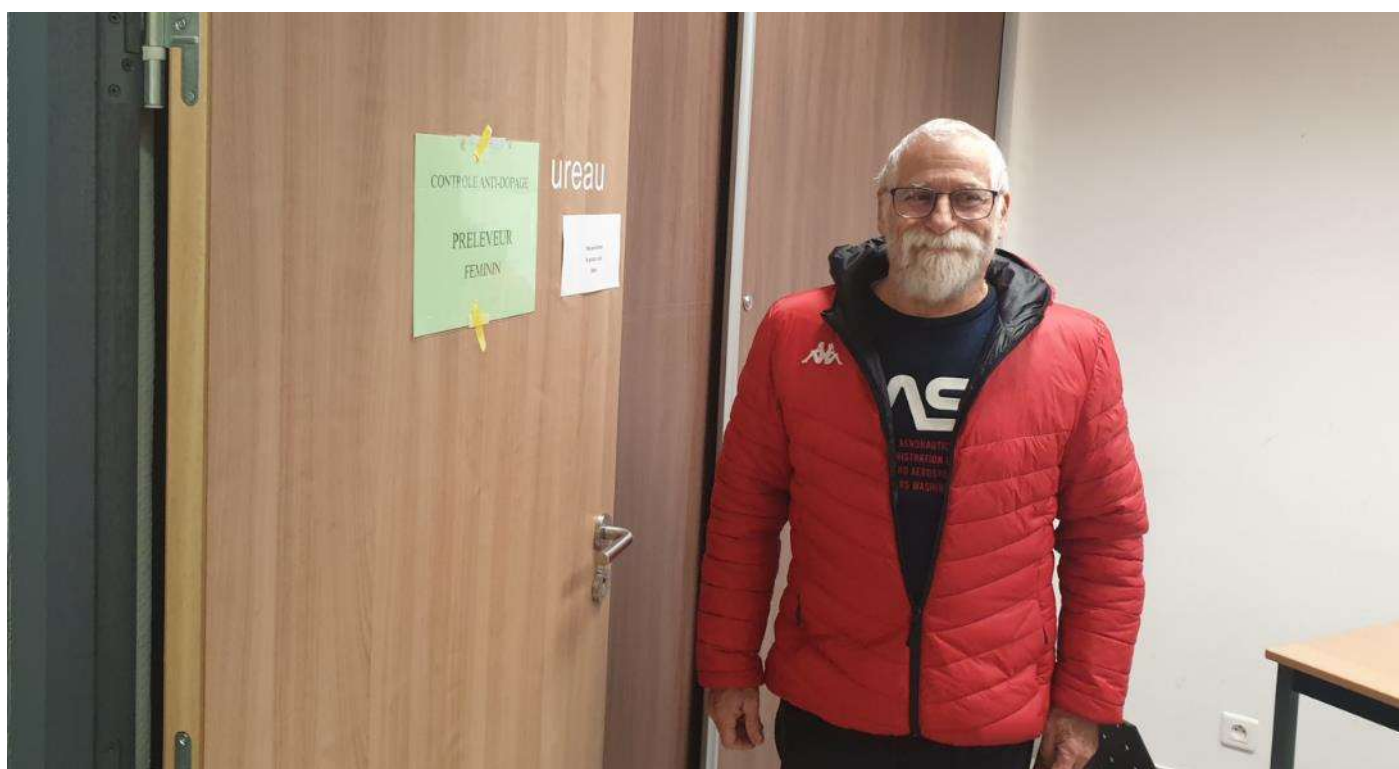
Des locaux anti dopages exemplaires et bien tenus