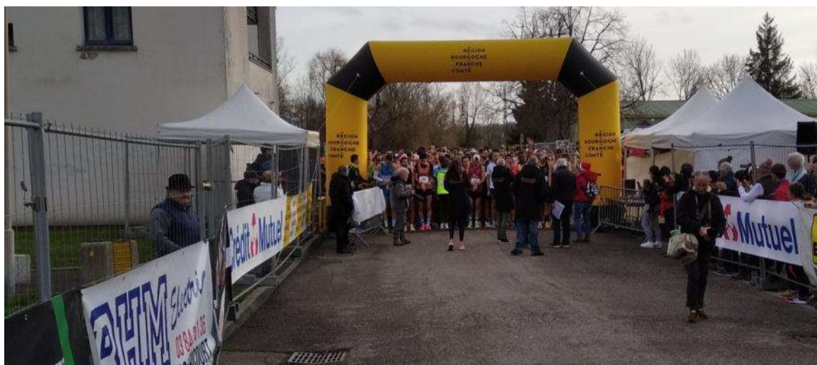
Départ rue Dolorès Ibarouri