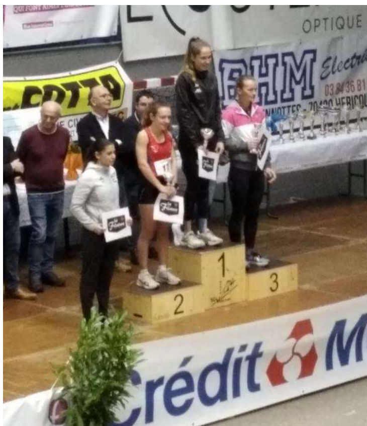
Remise des récompenses femmes