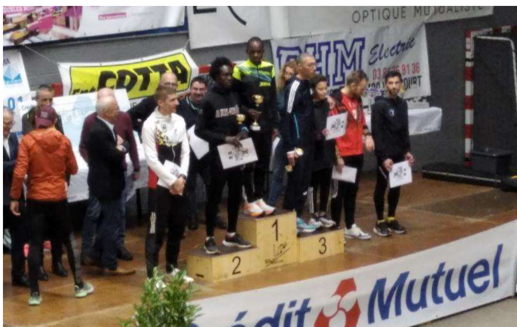
Remise des récompenses hommes