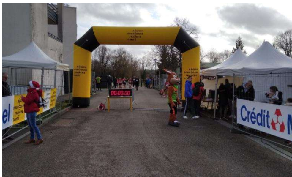
Arrivée rue Dolorès Ibarouri