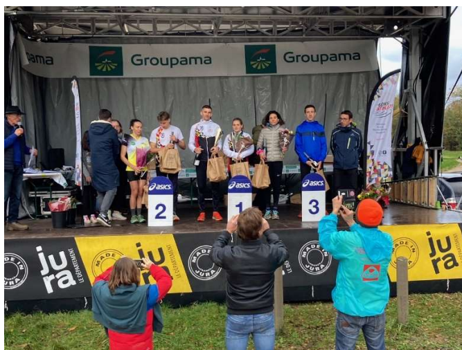
Podium scratch CLF et CLM