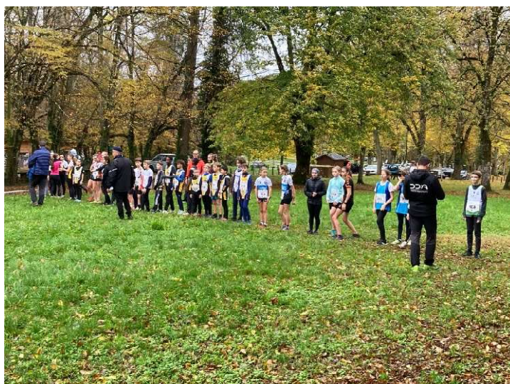
Départ course 1