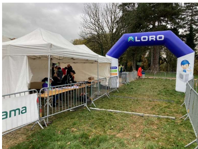
Ligne d'arrivée et poste de chronométrage