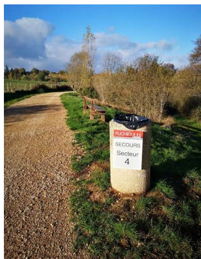
Identification des secteurs de secours sur le parcours