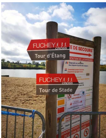
Indication des 2 boucles

J'ai pu parcourir à pied l'intégralité de la boucle autour du lac.