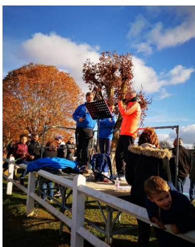
Speakers positionnés sur une estrade afin d'avoir une vue sur l'intégralité du parcours

Début des courses à 11h30 et commentées par 2 speakers avec remise des récompenses dès la fin de chaque épreuve.