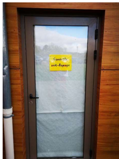
Le local est bien protégé des regards extérieurs et fermé à clef

Début des courses à 11h30 et commentées par 2 speakers avec remise des récompenses dès la fin de chaque épreuve.