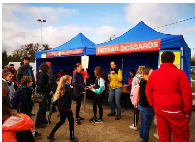
Tentes pour le retrait des dossards