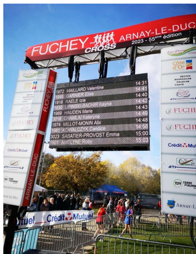
Affichage suite à la demande d'ajout du n° de dossard

Des corrections de classement ont été réalisées :