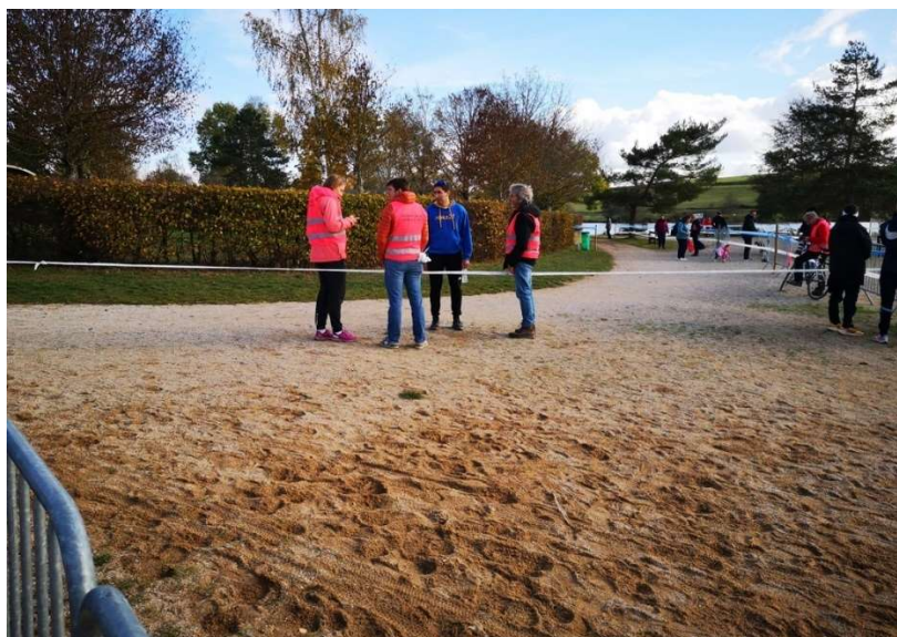
Orientation des coureurs en fonction des boucles par la mise en place de rubalises