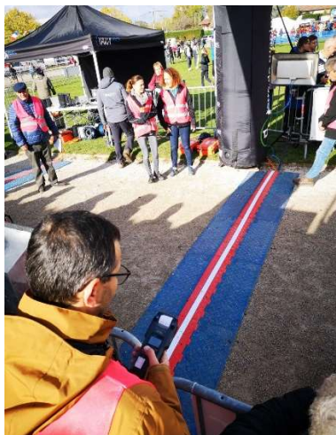
Chronométrateur en regard de la ligne d'arrivée

Le déroulement de l'ensemble des courses s'est bien passé, j'ai pu confirmer la régularité de la manifestation.