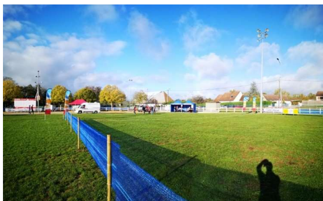
Aire de départ

Puis vérifier les installations autour du stade.