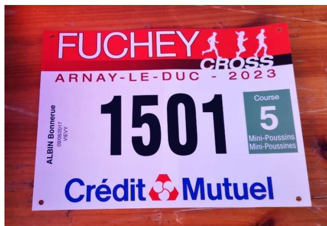
Dossard avec identification de la course

La réunion technique a eu lieu à 11h dans une salle mise à disposition par l'organisateur en présence des différents membres du jury ainsi que des candidats JURU qui passaient leur examen. On a relevé l'absence des juges à l'arrivée dans la fiche du jury alors qu'ils sont bien présents sur le site et devaient être rajoutés lors du chargement dans le SIFFA mais ce n'a pas été le cas.