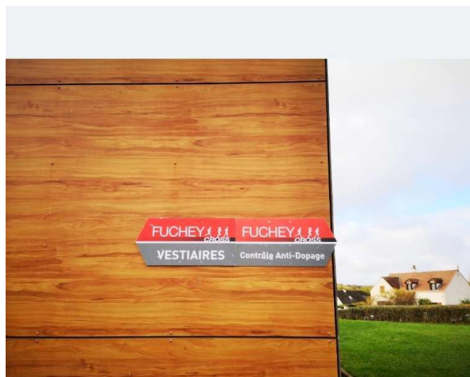
L'accès au local est bien identifié par des panneaux

A l'issue de la réunion, je me suis rendu au gymnase situé de l'autre côté de la route pour vérifier la conformité du local anti-dopage.