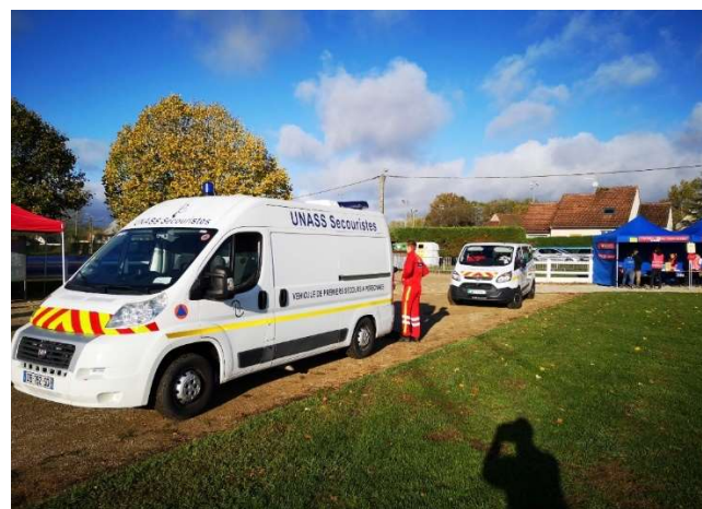
Véhicules de secours