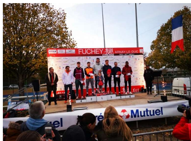
Cérémonie des récompenses avec les 6 premiers de chaque course