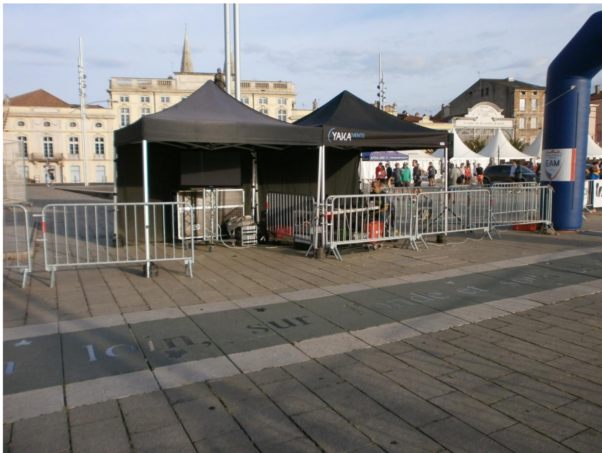
Poste de chronométrie