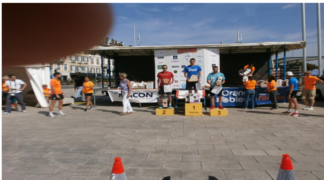
Podium des 3 premiers hommes