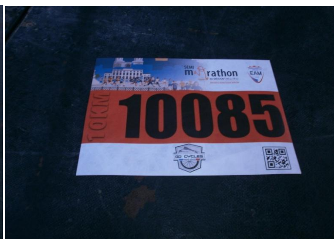
Dossard homme sans pastille