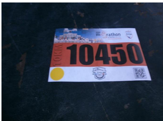
Dossard femme avec pastille