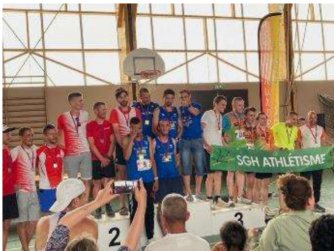
Podium championnats BFC équipes élites