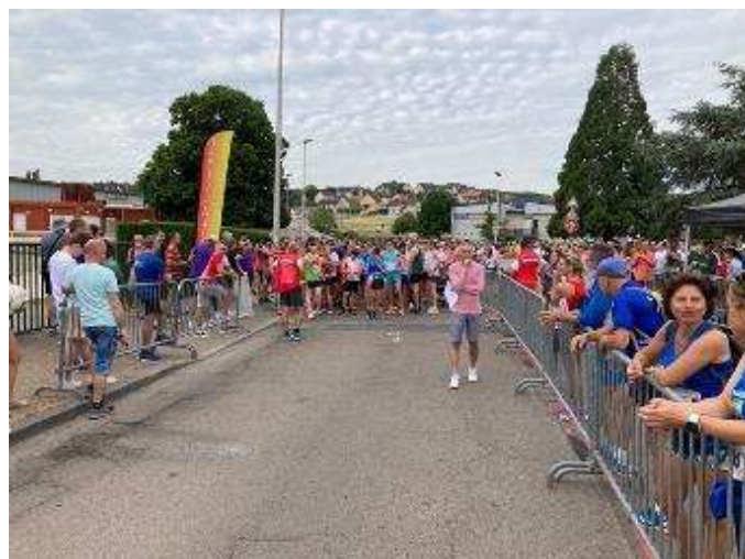
Juste avant le départ