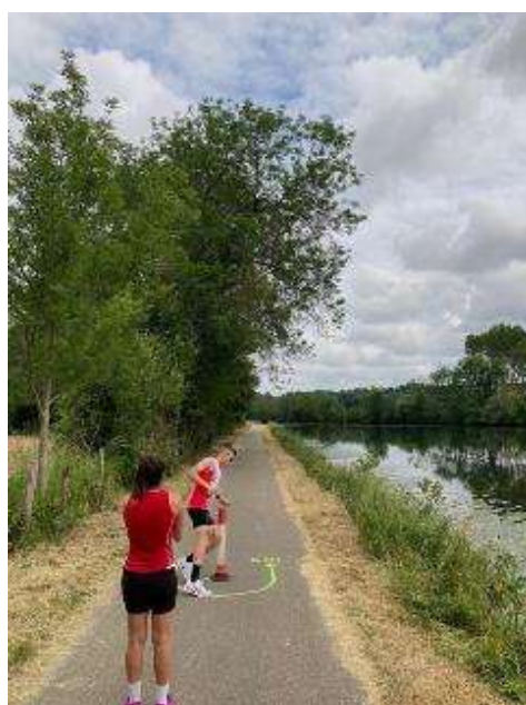
Demi-tour de la boucle supplémentaire (relais 6)