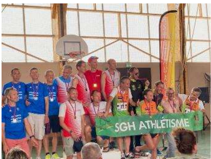
Podium championnats BFC équipe masters