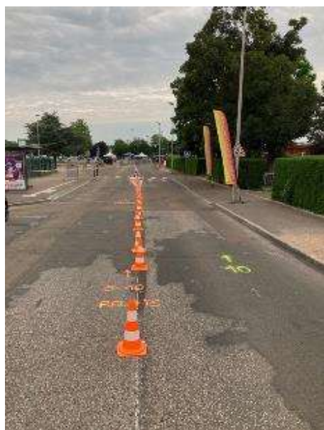
Zone de passage de relais