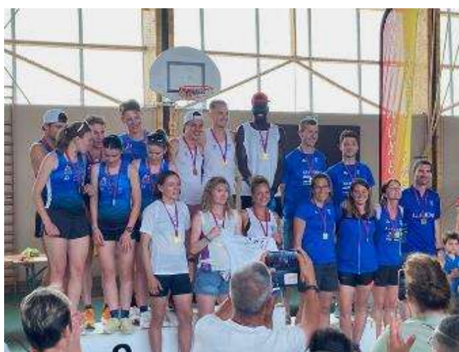
Podium championnats BFC équipes mixtes