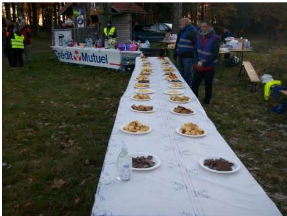
Ravitaillement à la Chaumière

Trois ravitaillement copieux sur le parcours avec des bénévoles forts sympathiques