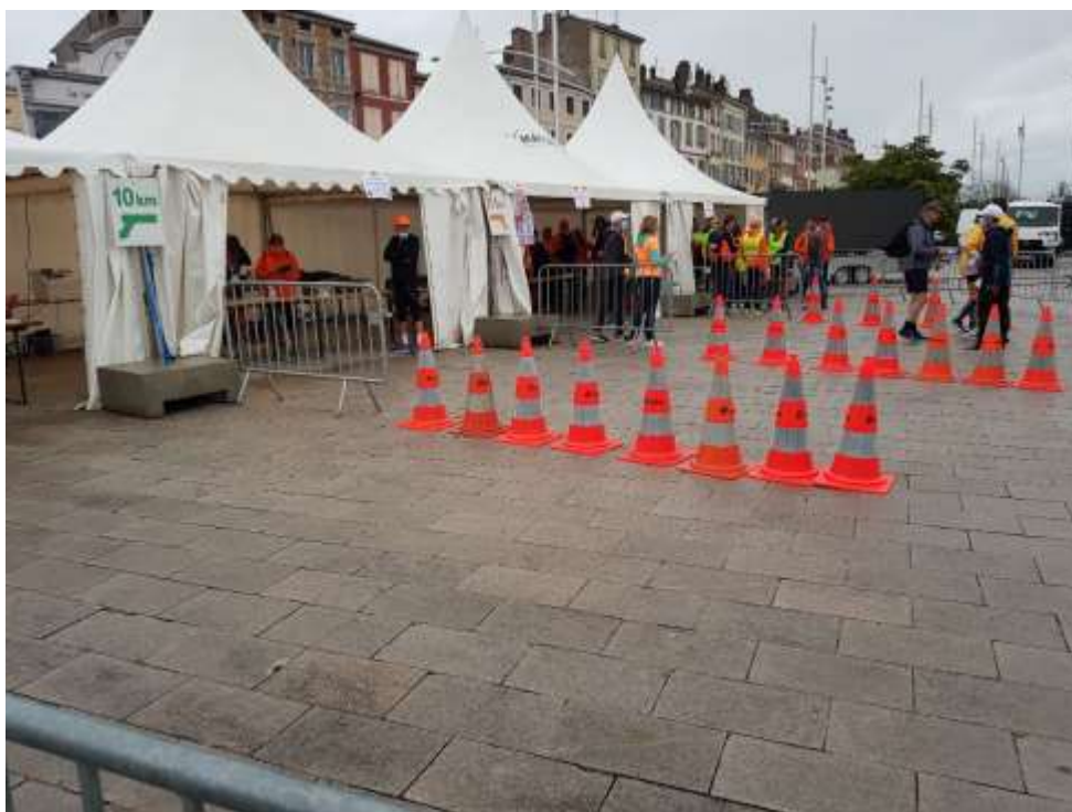
Bonne organisation du retrait des dossards