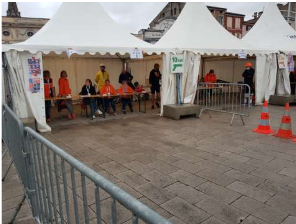
Retrait des dossards