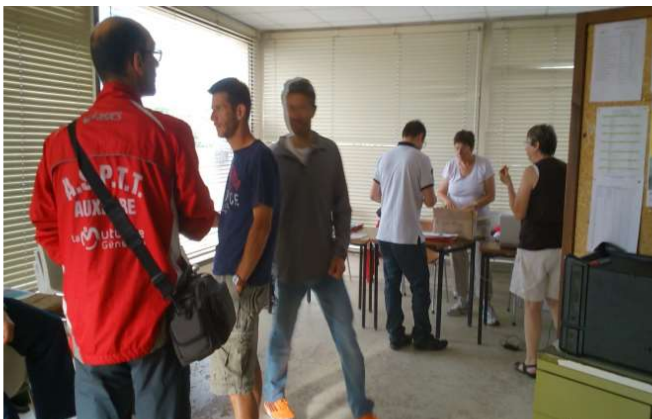
Inscriptions et retrait des dossards.

L'accueil des coureurs et les inscriptions se font dans une salle du stade d'athlétisme. Le certificat médical ou les licences sont demandés, comme précisés dans le bulletin d'inscription.