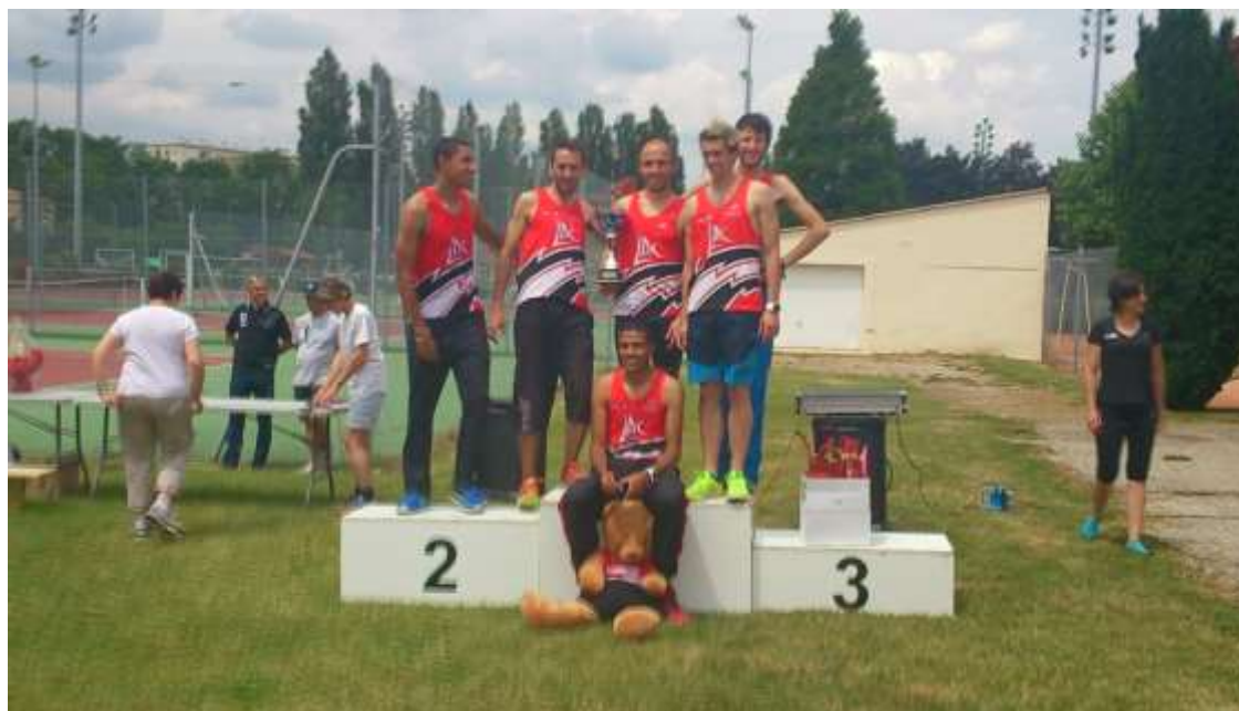
L'équipe SEM Lisses Ac victorieuse

C'est en plein air qu'a lieu la remise des récompenses. Elle est de bonne tenue.