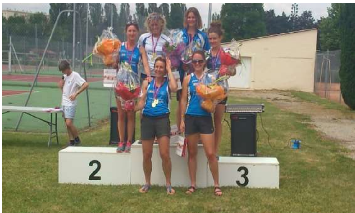
L'équipe SEF AJA Marathon victorieuse