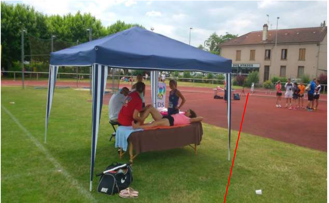
Stand de massage.