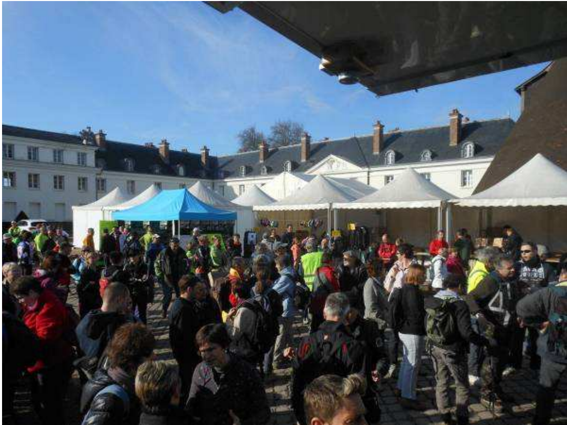
Le village course au Château de la Verrerie