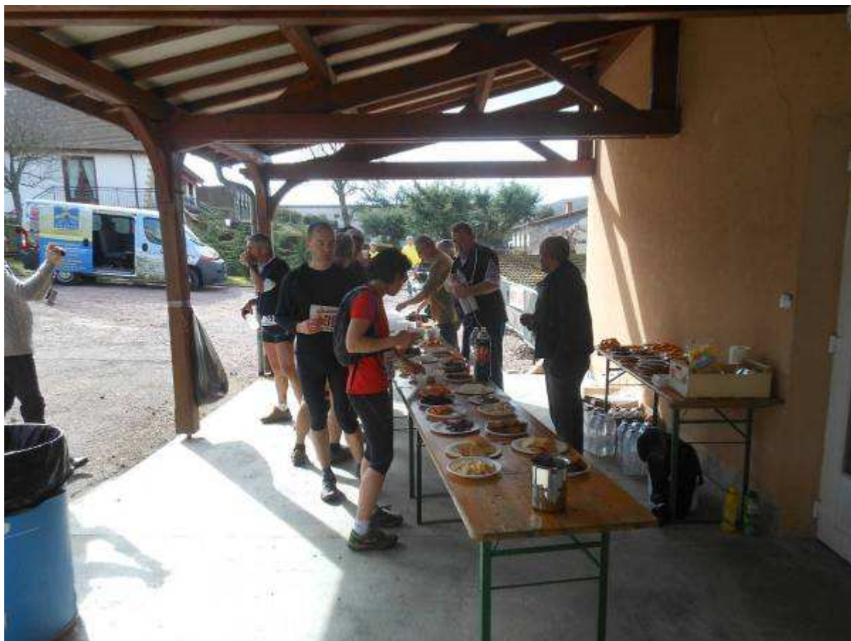
Les ravitaillements sont bien fournis et bien tenus