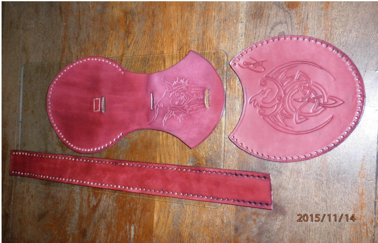
Teinture des parties du sac en prune obtenu en mélangeant du rouge éclatant + de l'acajou Eco Flo à l'eau