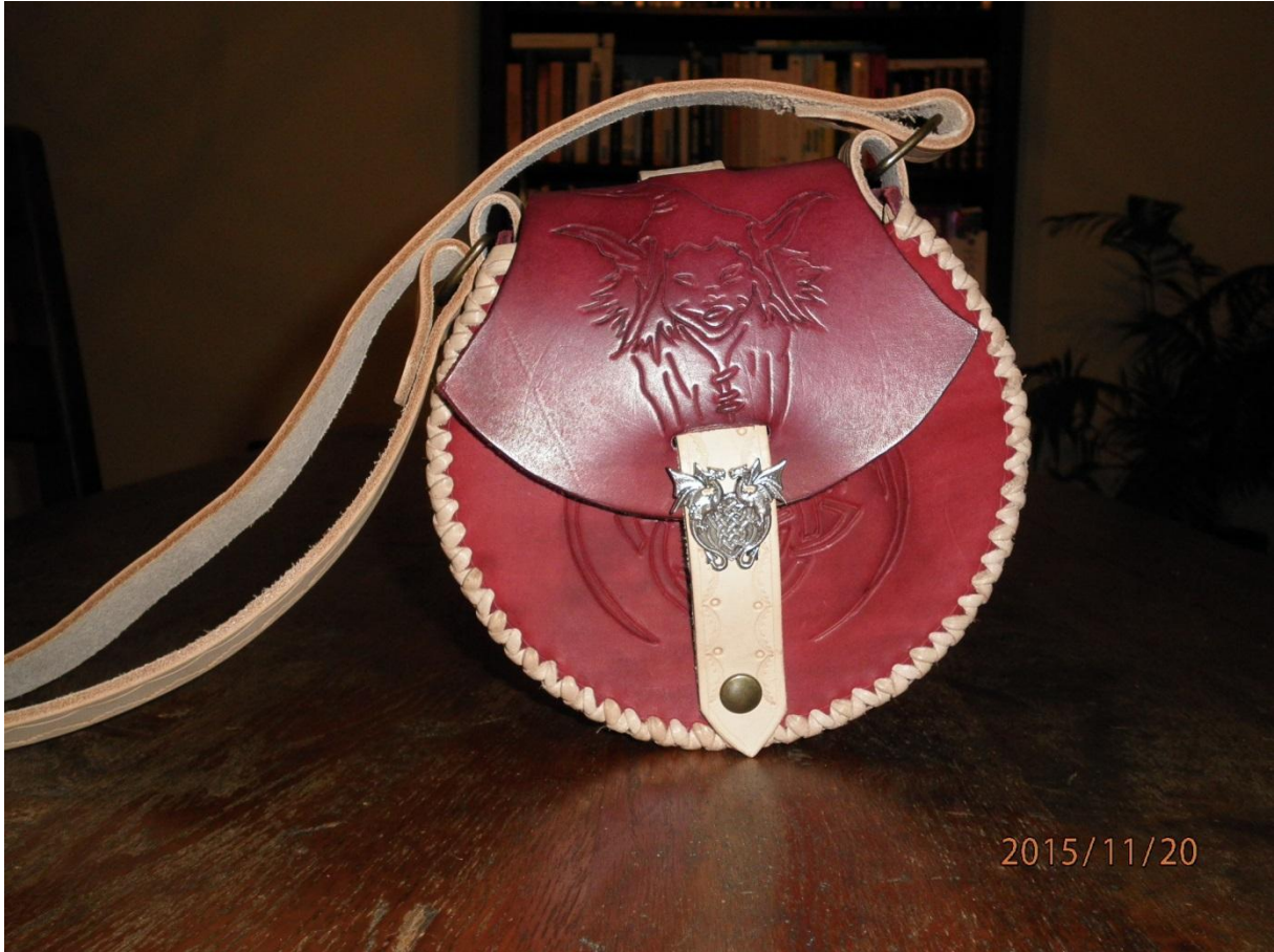
A vous de vous éclater !