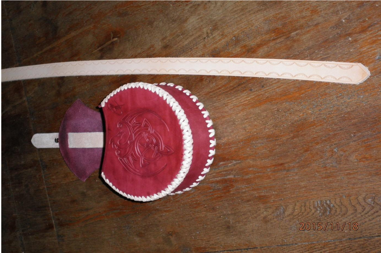
Pose du bouton pression et du rivet décoratif