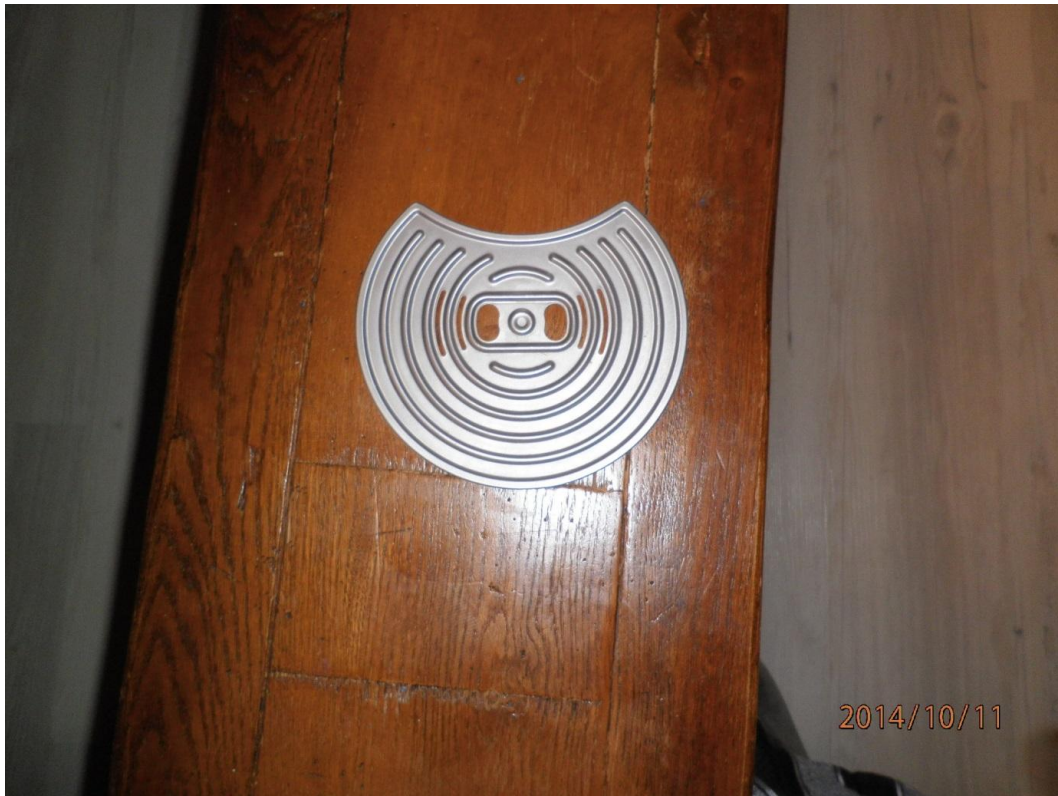
Comme patron j'ai utilisé la grille repose tasse de cafetière Senséo