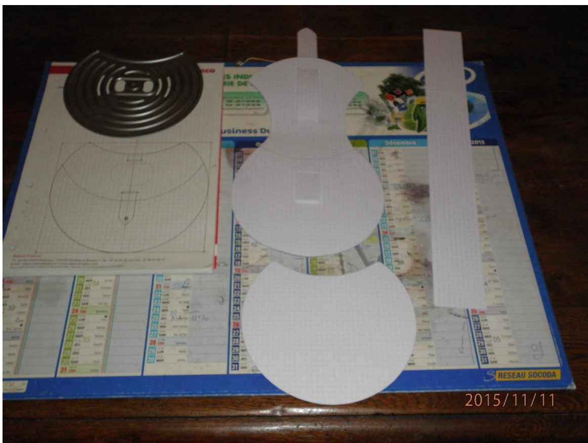
Fabrication du patron en carton (bristol)