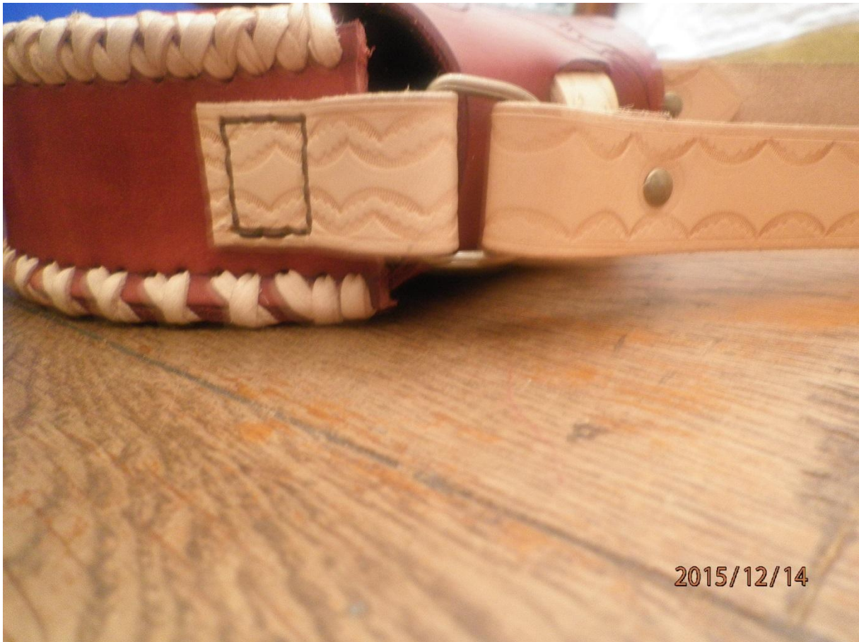
Et voilà un petit sac bien sympa !