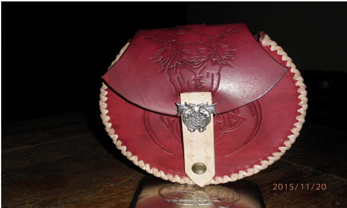
Pose de la sangle