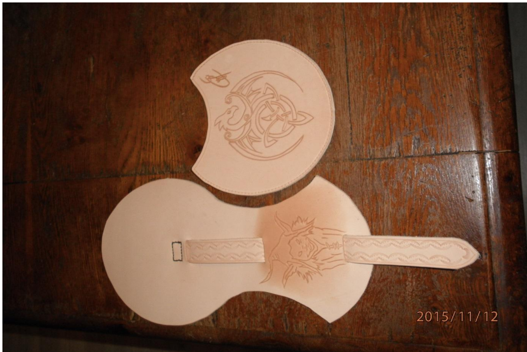
Décoration par gravure des motifs dragon et farfadet + décoration de sangle de fermeture