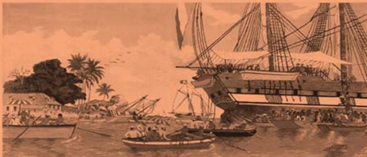
DÉBARQUEMENT DES COOLIS INDIENS A LA GUADELOUPE