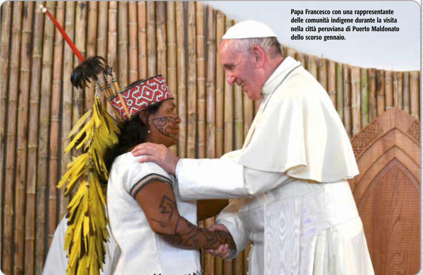
Papa Francesco con una rappresentante delle comunità indigene durante la visita nella città peruviana di Puerto Maldonado dello scorso gennaio.

Il biblista, infine, fa un passo avanti nel ragionamento. Perché dall'ecologia, dal tipo di Casa Comune che vogliamo costruire, «dipende l'economia, ossia le leggi della casa». Per questo, «discutere di ecologia senza discutere di economia è un controsenso molto forte: le leggi della Casa dipendono dal progetto di casa che noi abbiamo. Questo la Bibbia ce lo insegna. Qual è il progetto di Casa che Dio vuole per noi? Che tutti siano uno, che noi siamo fratelli, che il pane sia condiviso, che i poveri siano al centro. La casa come un insieme, come giardino, ma anche come residenza, cucina, camera da letto, stanza, corridoio. La nostra società». □