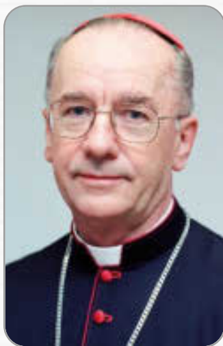
Il cardinale Cláudio Hummes, relatore generale del Sinodo sull'Amazzonia.

Il conflitto è tra due modelli alternativi tra loro: da una parte l'estrattivismo, che concepisce l'intera regione come uno spazio ricco di materie prime e risorse naturali ancora poco sfruttate; dall'altra la convivenza con il bioma, che valorizza ritmi di relazione con l'ambiente circostante che garantiscono la convivenza tra insediamenti umani e altri sistemi di vita. Tra i compiti del Sinodo, il documento pre-