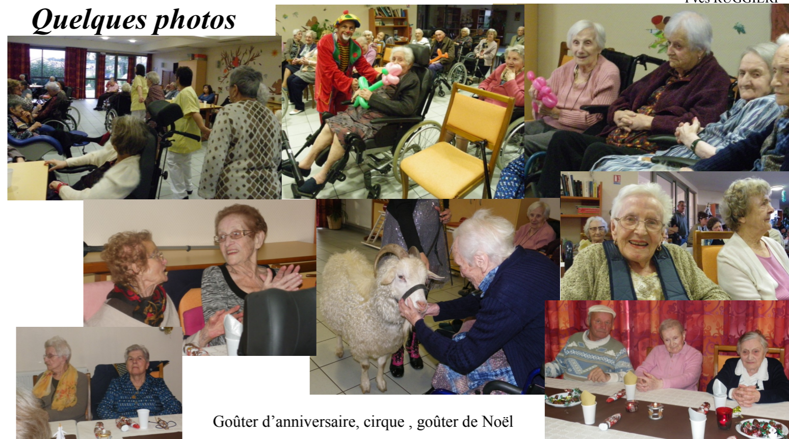
Goûter d'anniversaire, cirque, goûter de Noël