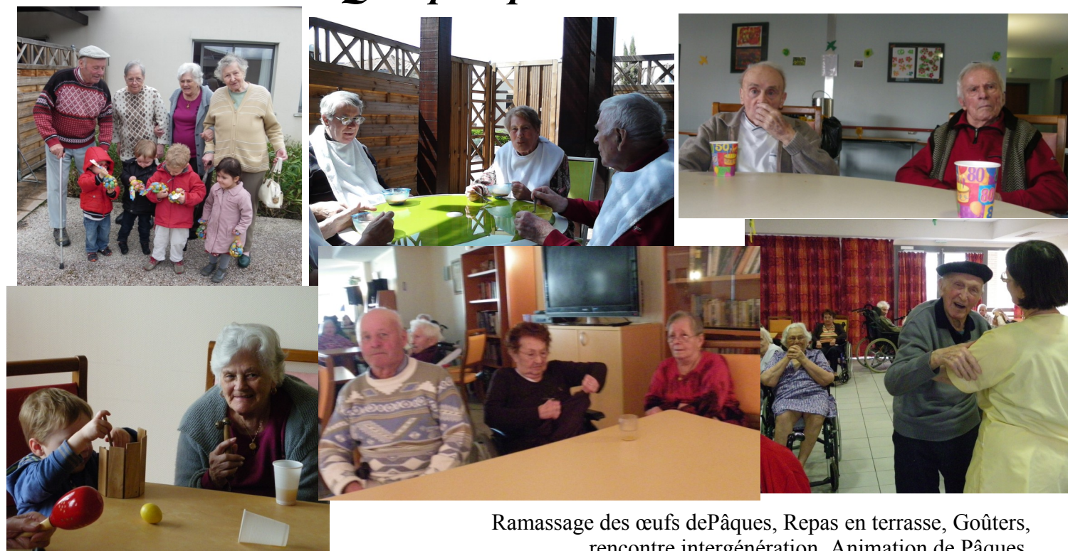
Ramassage des œufs de Pâques, Repas en terrasse, Goûters, rencontre intergénération, Animation de Pâques.