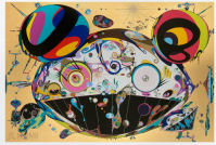
Série Dob Chaos, Takashi Série Dob Chaos, Takashi Murakami, huile sur toile, 2015

Takashi Murakami est surnommé « l'andy warhol japonais ». Son œuvre inspirée de la culture manga, et du pop art, présente un langage pictural aussi ambivalent qu' attractif avec des accents kitch... Entrez dans l'univers de cet artiste atypique, qui derrière ses peintures parodiques et ses sculptures étranges, questionne sur notre société.