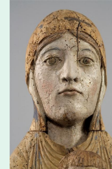
Vierge en Majesté, bois de noyer peint XII siècle, musée du Louvre

Charlotte Perriand est une des pionnières du design et de l'architecture en France : associée au célèbre architecte Le Corbusier, elle invente des formes de chaises, de fauteuils, de tables devenues des icônes du mobilier contemporain. Très inspirée par le Japon, sa conception minimaliste et fonctionnelle de l'espace et des formes, recherche constamment la beauté dans la simplicité