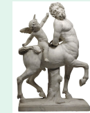
Centaure dompté par l'amour, Joseph Chinard, marbre, 1789, musée des beaux arts de Lyon

Plongée dans l'univers de la sculpture médiévale, pour en apprécier la symbolique et l'évolution du style entre le XII et le XIII siècle : je vous propose de décoder 4 œuvres : un statue religieuse, un reliquaire, des sarcophages, et des sculptures de cathédrale. Nous observerons les liens que ces œuvres tissent avec l'histoire, les enjeux de leur époque et d'autres arts.