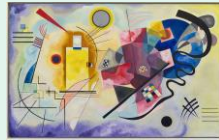
Jaune, rouge, bleu, 1925, Wassily Kandinsky, centre Pompidou Paris

Le XVII e siècle est appelé le siècle d'or, époque où l'art français, espagnol et flamand sont au centre de la scène artistique. Les styles classiques et baroques dictent les règles de l'art dans les cours d'Europe. Partons à la découverte de l'œuvre de Rubens, peintre baroque d'origine flamande, qui a travaillé pour la régente de France.