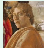
L'adoration des mages, 1475, galerie des Offices, Florence (détail)

Les arts Aborigènes ont été redécouverts dans les années soixante dix. Cette reconnaissance a permis aux habitants des terres rouges de perpétuer et de diffuser la beauté et la philosophie de leur art traditionnel. Après l'Australie, nous irons en Papouasie/Nouvelle Guinée, admirer masques et objets cérémoniels, mémoire des cultures de la mer de Corail.