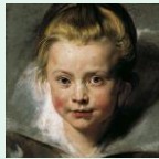
Serena Rubens, 1618, huile sur toile, 37 x 27cm, musée des Beaux arts de Bruxelles

Le travail de Yayoi Kusama relève de l'art conceptuel et minimaliste, imprégné de contenus féministes et autobiographies. Cette plasticienne puise dans la pop culture, et possède un univers très personnel, qui va vous faire voir les petits pois autrement ! Aujourd'hui Yayoi Kusama à 92 ans et c'est l'artiste féminine la mieux cotée au monde.