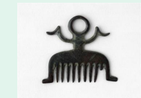
Peigne en bronze, musée des Antiquités Nationales

Voyage dans le Japon des XVIII e et XIX e siècles avec 3 peintres et graveurs : Utamaro, connu pour ses portraits féminins raffinés, Hokusai, le célèbre auteur des vues du mont Fuji et Hiroshige qui donna de nombreuses vues de la route reliant Edo à Kyoto, dans un style très animé. Ces artistes pratiquaient l'art de l'estampe en couleurs, une technique qui se développa à partir du XVII e s, et rencontra un grand succès lors de l'ouverture du Japon à la fin du XIX e .