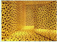
Dots obsession, installation, 2006 Yayoi Kusama

Le travail de Yayoi Kusama relève de l'art conceptuel et minimaliste, imprégné de contenus féministes et autobiographies. Cette plasticienne puise dans la pop culture, et possède un univers très personnel, qui va vous faire voir les petits pois autrement ! Aujourd'hui Yayoi Kusama à 92 ans et c'est l'artiste féminine la mieux cotée au monde.