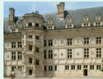
Château de Blois, aile François 1 er

L'abstraction est un vaste mouvement aux formes multiples : des improvisations colorées, en passant par la géométrie radicale ou les énigmatiques monochromes. Je vous propose de revenir aux origines de cette forme d'art, en nous immergeant, dans cette pratique picturale « qui présente » au lieu « de représenter » avec les 2 grands noms de l'abstraction et pionniers de cette expression artistique : Kandinsky et Mondrian.