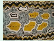
Tableau Aborigène, techniques mixtes, milieu du XX e s, musée du Quai Branly

La région des châteaux de la Loire, est marquée par une concentration exceptionnelle de demeures seigneuriales et royales. A la renaissance, la manière italienne transforme le château fort en demeure de plaisance et fait de l'architecture une œuvre globale symbole d'équilibre et d'harmonie. Nous longerons la Loire et nous revivrons l'histoire de six châteaux habités par les rois de France.