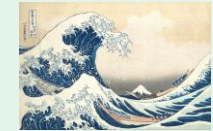
La grande vague de Kanagawa, Estampe, les trente-six vues du mont Fuji, 1830, Hokusai

L'art roman se développe dès le X e siècle en France en se déclinant sous la forme de différentes écoles. Nous regarderons une sélection de monuments religieux d'envergure : églises, abbayes, et prieurés, construits entre le XI e et le XIII e siècles, dans 7 régions françaises.