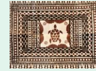
Tapa tahitien, écorce peinte, début du XIX e s, musée de Tahiti

Le XV e siècle en Italie est appelé le Quattrocento : c'est une époque d'innovations dans le domaine de la géométrie, de la perspective ou de l'anatomie. Nous observerons les tableaux de trois peintres qui ont pour ambition de mener la peinture vers plus de réalisme et de spatialité : Paolo Uccello, Andrea Mantegna et Sandro Botticelli.