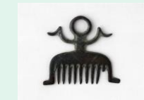
Peigne en bronze, musée des Antiquités Nationales

Voyage dans le Japon des XVIII e et XIX e siècles avec 3 peintres et graveurs : Utamaro, connu pour ses portraits féminins raffinés, Hokusai, le célèbre auteur des vues du mont Fuji et Hiroshige qui donna de nombreuses vues de la route reliant Edo à Kyoto, dans un style très animé. Ces artistes pratiquaient l'art de l'estampe en couleurs, une technique qui se développa à partir du XVII e s, et rencontra un grand succès lors de l'ouverture du Japon à la fin du XIX e .