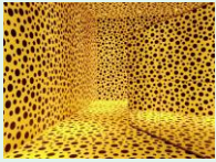
Dots obsession, installation, 2006 Yayoi Kusama

Le travail de Yayoi Kusama relève de l'art conceptuel et minimaliste, imprégné de contenus féministes et autobiographiques. Cette plasticienne puise dans la pop culture, et possède un univers très personnel, qui va vous faire voir les petits pois autrement ! Aujourd'hui Yayoi Kusama à 92 ans et c'est l'artiste féminine la mieux cotée au monde.