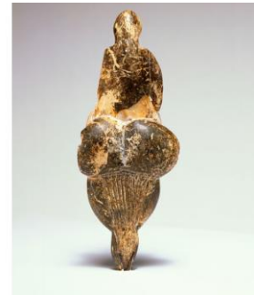
vénus de Lespugue, musée des antiquités nationales de st germain en Laye

http://www.museedelhomme.fr/fr/musee/collections/venus-lespugue-3859 http://theswedishparrot.com/sept-femmes-venus-du-gravettien/