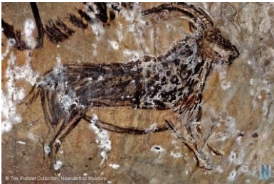
grotte de Niaux, Tarascon sur Ariège

https://musee-archeologienationale.fr/objet/le-cheval-de-lourdes