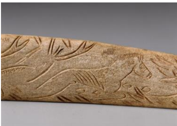
lissoir gravé, grotte de la vache, ariège

http://www.sites-touristiques-ariège.fr/sites-touristiques-ariège/grotte-du-mas-dazil