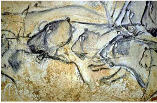
grotte Chauvet, vallon pont d'arc http://archeologie.culture.fr/chaudet/fr https://www.grottechauvet2ardeche.com/