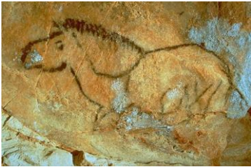
grotte Cosquer, Marseille

http://archeologie.culture.fr/fr/a-propos/grotte-cosquer https://madeinmarseille.net/15317-grotte-cosquer-visite-calanque/