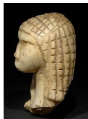
vénus de Brassempouy, musée des antiquités nationales de Germain en laye

http://www.museedelhomme.fr/fr/musee/collections/venus-lespugue-3859 http://theswedishparrot.com/sept-femmes-venus-du-gravettien/