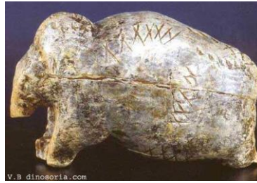
bestiaire de Vogelherd, Allemagne

https://www.dinosoria.com/art_aurignacien.htm http://theswedishparrot.com/premices-du-style-lanimal-aurignacien/ https://www.hisour.com/fr/art-of-the-upper-paleolithic-36220/