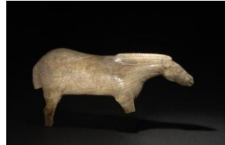
cheval des espéluques, Lourdes

https://www.lascaux.fr/fr http://www.lascaux-dordogne.com/fr/la-grotte-de-lascaux