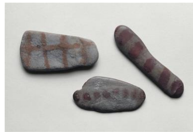
galets peints, grotte du mas d'Azil, ariège

http://www.sites-touristiques-ariège.fr/sites-touristiques-ariège/grotte-de-niaux