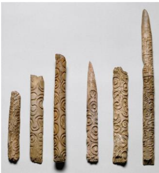
baguettes rondes gravées,

https://www.hominides.com/html/actualites/art-parietal-borneo-40000-ans-1307.php