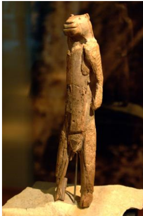
vénus de Hohle Fels et homme lion de Hohlstein stadel

https://www.hominides.com/html/lieux/hohle-fels.php https://www.museum.toulouse.fr/-/nos-ancetres-les-aurignaciens