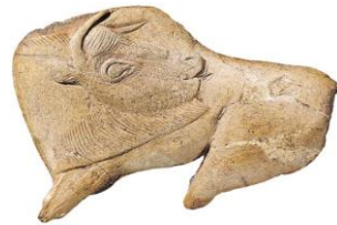
bison gravé, abri de la madeleine, Dordogne

http://archeologie.culture.fr/fr/a-propos/grotte-cosquer https://madeinmarseille.net/15317-grotte-cosquer-visite-calanque/