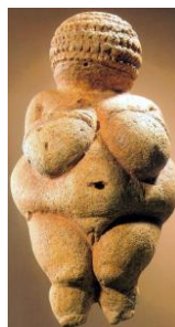
vénus de Willendorf, musée d'histoire naturelle de Vienne

https://www.hominides.com/html/art/venus-a-la-corne-laussel.php