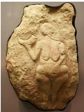
vénus de Laussel, Dordogne

https://www.hominides.com/html/art/venus_art_mobilier.php