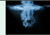
Five angels for millénium, 2001, Bill Viola, Paris centre Pompidou

La vidéo qui a fait son apparition dans les pratiques artistiques il y a une cinquantaine d'années a révolutionné le concept d'installation : les images sur écran, en mouvement sont devenus de nouveaux outils au service d'esthétiques jouant du format, et provoquant des émotions immersives.