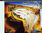
Persistance de la mémoire (détail) 1931, Salvador Dali, Moma New york

L'effervescence créative qui anime le début du XX s voit naître plusieurs mouvements avec un nouveau rapport à l'art, des remises en question fondamentales qui accompagnent les inventions et les turbulences du XX s.