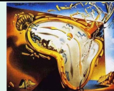
Persistence de la mémoire (détail) 1931, Salvador Dali, Moma New york

L'effervescence créative qui anime le début du XX s voit naître plusieurs mouvements avec un nouveau rapport à l'art, des remises en question fondamentales qui accompagnent les inventions et les turbulences du XX s.