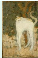
Le chat blanc, 1894, Pierre Bonnard, musée d'Orsay

A la fin du XIX siècle, un nouveau groupe d'avant-garde émerge, nommé « les nabis ». Héritiers du « synthétisme », ces peintres se décrivent comme étant des « symbolistes » et abordent la représentation avec un usage libéré des couleurs et un traitement de l'espace sans perspective.