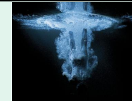
Five angels for millénium, 2001, Bill Viola, Paris centre Pompidou

La vidéo qui a fait son apparition dans les pratiques artistiques il y a une cinquantaine d'années a révolutionné le concept d'installation : les images sur écran, en mouvement sont devenus de nouveaux outils au service d'esthétiques jouant du format, et provoquant des émotions immersives.