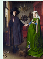
Les époux Arnolfini, 1434, Jan Van Eyck, Londres National gallery

La région flamande est un des foyers artistiques les plus actifs et influents pour l'évolution de la peinture à la fin du moyen âge : travail sur la perspective, rendu des matières, jeux de lumière et la composition dans le but de produire des effets de réalité saisissants.