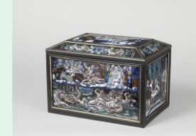
Coffret en émail peint et or, pierre Courteys, vers 1570, musée du Louvre

Nous regarderons meubles, vaisselle, bijoux, et enluminures du XVI s. : bois sculpté, verre soufflé et ciselé, émail peint, camées, faïences, cuirs, des pièces raffinées et luxueuses réalisées par les meilleurs créateurs de l'époque pour différentes cours.