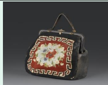
Sac de voyage, 1830, Compiègne, musée de la voiture

Une Sélection de mobilier et d'objets réalisés à l'époque du Directoire, de la Restauration et du Premier empire. Une séance qui nous plongera dans le goût de l'époque, avec ses nouvelles sources d'inspiration et ses innovations.