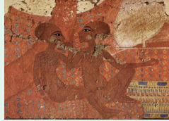
Fresque d'amarna représentant les filles de Néfertiti et d'Akhenaton, musée du Caire

Voyage dans la civilisation Egyptienne : fresques, statues, mobiliers, parures, nous livrent des témoignages de la vie quotidienne, des croyances et mythes de cette extraordinaire civilisation au travers de pièces donc les plus anciennes ont autour de 4000 ans.