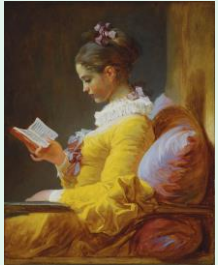
La liseuse, 1770, J.H. Fragonard, Washington national gallery

Présentation de trois peintres français à l'époque « rococo » et « néoclassique » : Antoine Watteau, François Boucher, et Jean-Honoré Fragonard.