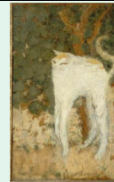
Le chat blanc, 1894, Pierre Bonnard, musée d'Orsay

A la fin du XIX siècle, un nouveau groupe d'avant-garde émerge, nommé « les nabis ». Héritiers du « synthétisme », ces peintres se décrivent comme étant des « symbolistes » et abordent la représentation avec un usage libéré des couleurs et un traitement de l'espace sans perspective.