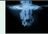
Five angels for millénium, 2001, Bill Viola, Paris centre Pompidou

La vidéo qui a fait son apparition dans les pratiques artistiques il y a une cinquantaine d'années a révolutionné le concept d'installation : les images sur écran, en mouvement sont devenus de nouveaux outils au service d'esthétiques jouant du format, et provoquant des émotions immersives.