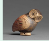
Aryballe en forme de chouette, VII s av. jc, musée du Louvre

Immersion dans le monde égéen avec la civilisation grecque « archaïque » : au temps des premiers temples de pierres, les créations de cette période se trouvent au cœur d'influences diverses au service des légendes et du sacré.