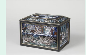
Coffret en émail peint et or, pierre Courteys, vers 1570, musée du Louvre

Nous regarderons meubles, vaisselle, bijoux, et enluminures du XVI s. : bois sculpté, verre soufflé et ciselé, émail peint, camées, faïences, cuirs, des pièces raffinées et luxueuses réalisées par les meilleurs créateurs de l'époque pour différentes cours.