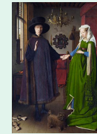
Les époux Arnolfini, 1434, Jan Van Eyck, Londres National gallery

La région flamande est un des foyers artistiques les plus actifs et influents pour l'évolution de la peinture à la fin du moyen age : travail sur la perspective, rendu des matières, jeux de lumière et de composition dans le but de produire des effets de réalité saisissants.