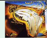
Persistence de la mémoire (détail) 1931, Salvador Dali, Moma New york

L'effervescence créative qui anime le début du XX s voit naître plusieurs mouvements avec un nouveau rapport à l'art, des remises en question fondamentales qui accompagnent les inventions et les turbulences du XX s.