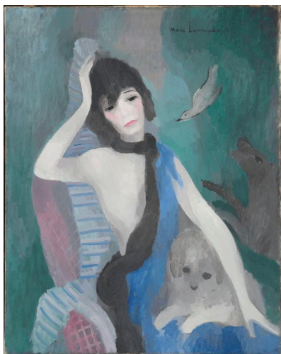
La couturière mademoiselle Chanel 1924 musée de l'orangerie

https://slash-paris.com/evenements/marie-laurencin