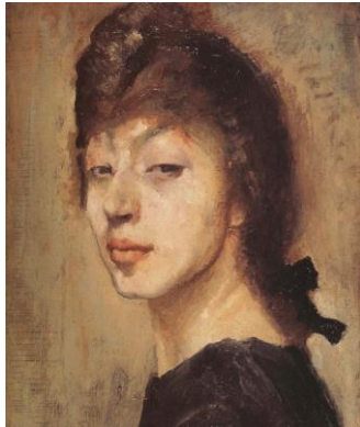
autoportrait de marie laurencin 1904, musée Laurencin, Japon

https://bibliotheques-specialisees.paris.fr/ark:/73873/pf0000865471/v0001.simple_selectedTab=record