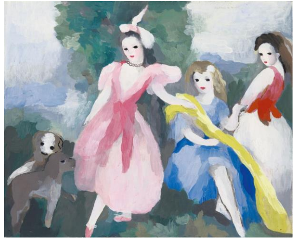
Jeunes filles et chiens, musée de l'orangerie

http://www.musee-orangerie.fr/en/artist/marie-laurencin