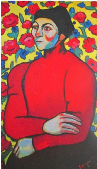
Philomène 1907, centre pompidou paris http://collections.madparis.fr/skinwebsearch?f%5B0%5D=field_skfulltext%3Adelaunay