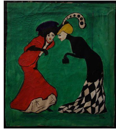
projet de publicité, 1908, Bnf paris http://www.spectacles-selection.com/archives/expositions/fiche_expo_S/sonia-delaunay-V/sonia-delaunay.htm