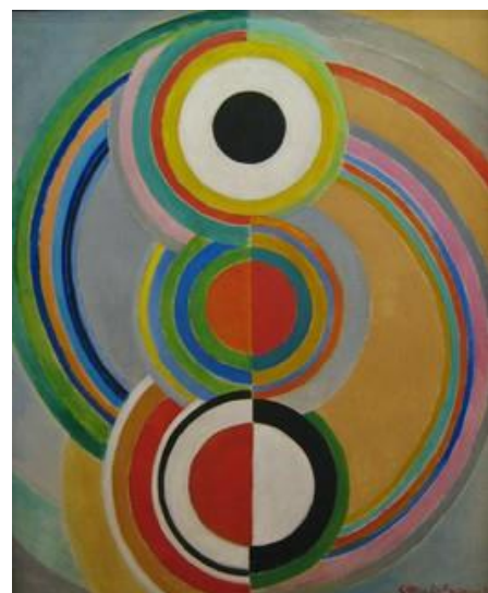
rythmes 1938 cgp https://culturebox.francetvinfo.fr/mode/la-mode-d-alla-malomane-fait-revivre-l-oeuvre-de-sonia-delaunay-154983 dossier sur l'exposition couleurs de l'abstraction 2014 http://www.mam.paris.fr/sites/default/files/documents/dossier-pedagogique-delaunay-mam.pdf