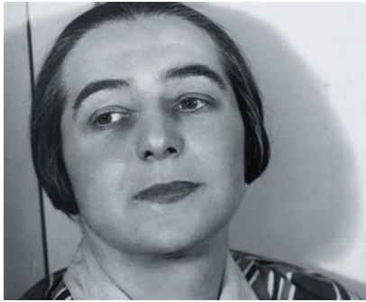
Sonia Delaunay