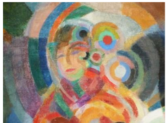
chanteur de flamenco, 1916 Lisbonne http://elisabeth.blog.lemonde.fr/2015/01/30/sonia-delaunay/ http://www.artnet.fr/artistes/sonia-delaunay-terk/