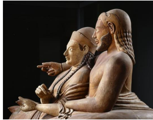
sarcophage des époux, VI s av jc, musée du louvre https://pacmusee.qc.ca/fr/expositions/detail/les-etrusques-civilisation-de-l-italie-ancienne/