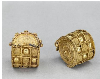
Boucles d'oreille en or filigrané, musée du louvre https://www.louvre.fr/oeuvre-notices/paire-de-boucles-d-oreilles