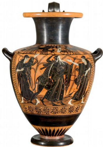
Hydrie à figures noires VI s av jc, Bnf http://medaillesetantiques.bnf.fr/ws/catalogue/app/collection/record/ark:/12148/c33gbq86g