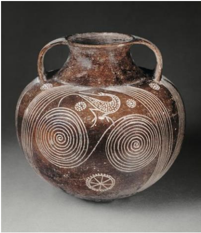
amphore à spirales, VIII siècle av jc, musée du louvre