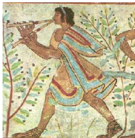
tombe de Tarquinia https://whc.unesco.org/fr/list/1158/ https://fr.wikipedia.org/wiki/N%C3%A9cropole_de_Monterozzi https://www.arretetonchar.fr/la-peinture-%C3%A9trusque/ sarcophages : https://www.finestresullarte.info/831n_come-vestivano-etruschi-moda-toscana-2600-anni-fa.php

chevaux de Tarquinia http://www.wikiwand.com/fr/Chevaux_ail%C3%A9s_de_Tarquinia