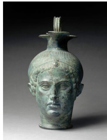
oenoché plastique, musée du louvre http://cartelfr.louvre.fr/cartelfr/visite?srv=car_not_frame&idNoti ce=28083&langue=fr