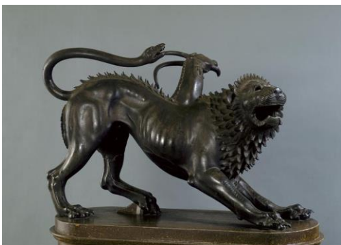
chimère en bronze, musée archéologique de Florence