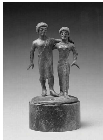
statue votive, musée du louvre http://cartelfr.louvre.fr/cartelfr/visite?srv=car_not_frame&idNoti ce=29964&langue=fr