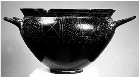
cratère « Bucchero », musée du louvre http://cartelfr.louvre.fr/cartelfr/visite?srv=car_not_frame&idNoti ce=25036&langue=fr