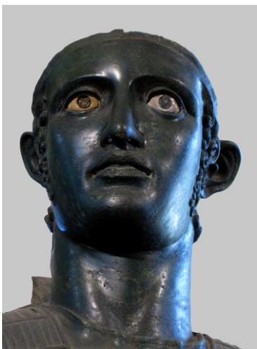
mars de Todi, musée étrusque du Vatican, Rome http://www.museivaticani.va/content/museivaticani/it/collezioni/musei/museo-gregoriano-etrusco/sala-iii--bronzi/marte-di-todi.html

l'arringatore : https://icono.ulb.ac.be/cdm/singleitem/collection/shu013/id/138/rec/1