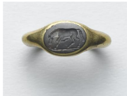
bague en jasper et or, orné d'un cheval, musée du louvre