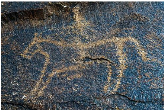
Site archéologique de Tamgal, Kazakhstan https://whc.unesco.org/?cid=31&l=fr&id_site=1145&gallery=1&index=25&maxrows=12