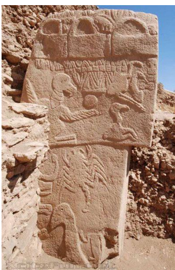
Gobekli Tepe, Turquie https://whc.unesco.org/fr/list/1572/ https://www.nouvelobs.com/sciences/20170721.OBS2419/gobekli-tepe-le-temple-mysterieux-qui-alimente-toutes-les-theories.html