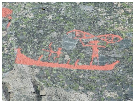
site rupestre de Tanum, suède http://whc.unesco.org/fr/list/557 http://lefildutemps.free.fr/suede_rupestre/tanum.htm http://www.tresorsdumonde.fr/gravures-rupestres-de-tanum/