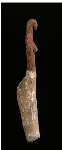
statuette en céramique, Egypte https://www.photo.rmn.fr/CS.aspx?VP3=SearchResult&VBI D=2C05PCAKR25W7&SMLS=1&RW=1600&RH=786 https://mythologica.fr/egypte/histo/predyn.htm