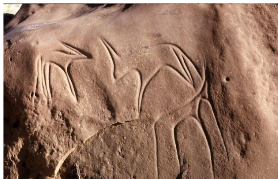
gravures rupestres du sahara algérien http://algerieterredafrique.blogspot.fr/2012/07/gravures-rupestres-de-la-region-dain.html#.UADu0uqk8g.scoopit http://algerieterredafrique.blogspot.fr/2012/07/lalgerie-dans-la-prehistoire.html#.UADl1foFGUc.scoopit http://data.abuledu.org/wp/?LOM=25261 vidéos : https://www.carnets-audiovisuels.fr/diaporamas-libye/ https://www.youtube.com/watch?v=7atnoxWAwqA https://www.youtube.com/watch?v=AWI4-HKAF5Y