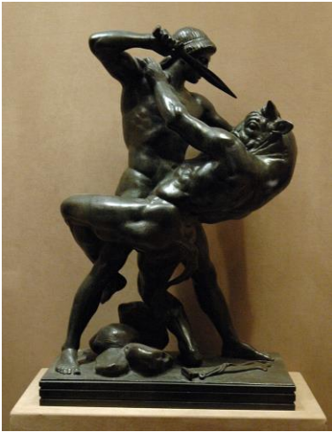
thésée et le minotaure, bronze, par Barye