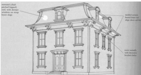
l'architecture haussmannienne « second empire »

http://passerelles.bnf.fr/batiments/haussmann_planche.php