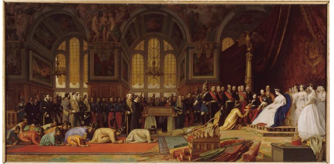
réception des ambassadeurs, 1864 par Jean-Léon Gérôme

https://www.youtube.com/watch?v=S5m8pycd4SY