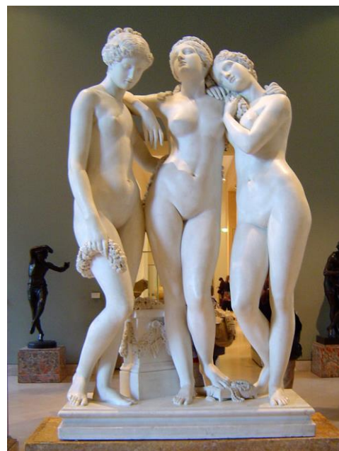
Les 3 grâces, par James Pradier, musée du Louvre http://cartelen.louvre.fr/cartelen/visite?srv=car_not_frame&idNotice=2650