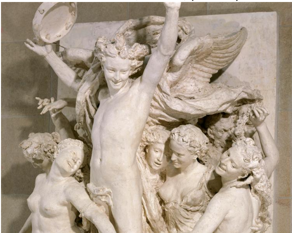
la danse (détail) pierre, par Jean-Baptiste Carpeaux