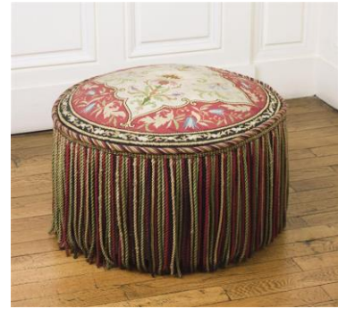
pouf napoléon III