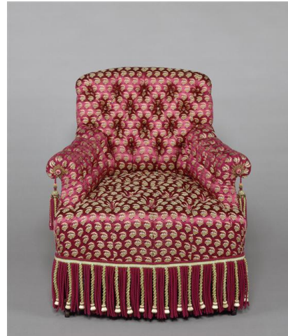
fauteuil « crapaud » château de Fontainebleau