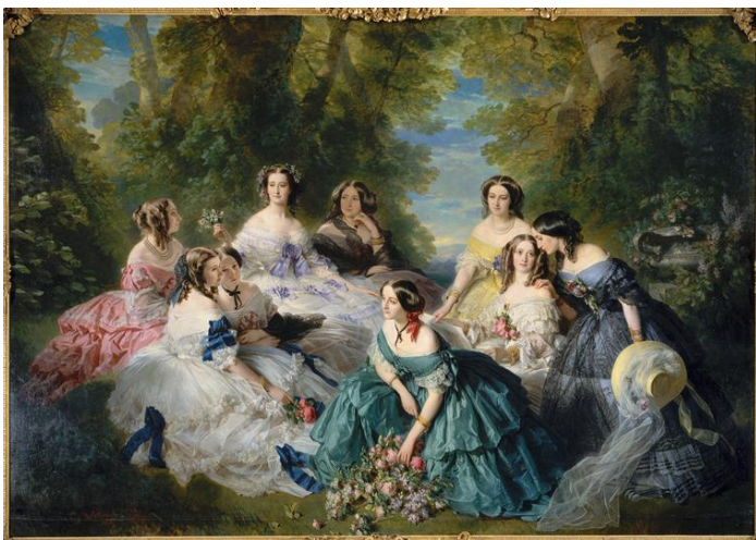
l'impératrice et ses dames d'honneur, 1855, par Franz Winterhalter