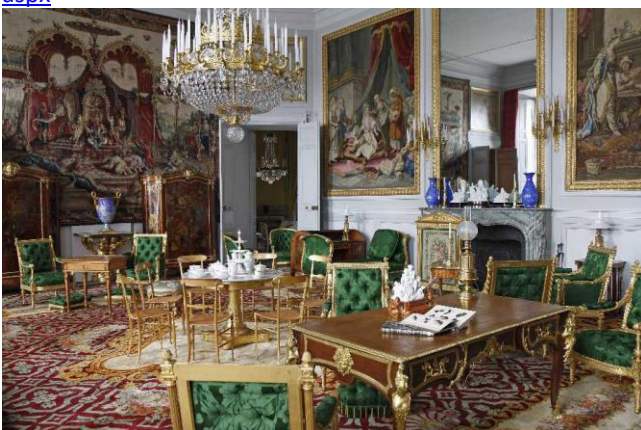
salon de thé du château de Compiègne (style « Louis XVI Impératrice »)