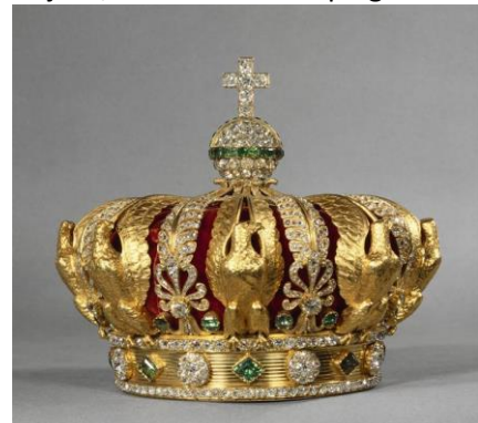
couronne de l'impératrice, musée du Louvre