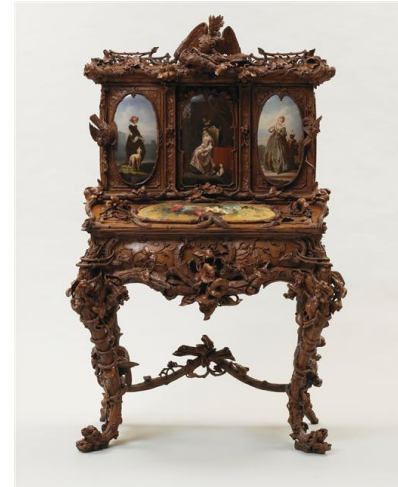
bonheur du jour, château de Compiègne

http://www.historicplaces.ca/fr/pages/29_second_empire.aspx