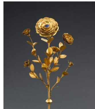
rose en or du trésor de la cathédrale de Bâle XIV s