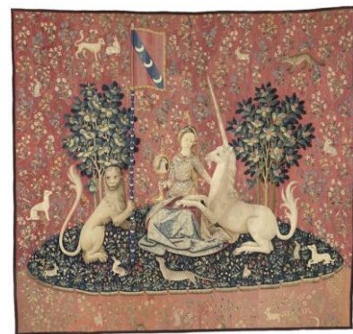
tapisserie de la dame à la licorne XV s

http://www.musee-moyenage.fr/collection/oeuvre/coffre-de-poissy.html