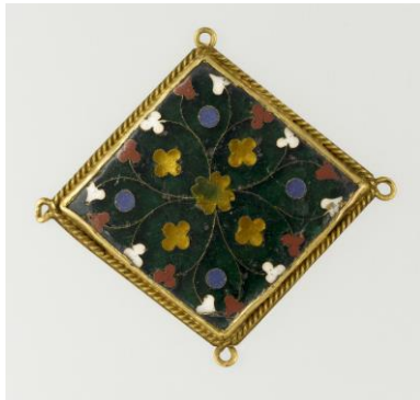
ornement de vêtement en émail cloisonné, XIII s

http://www.inrap.fr/magazine/st-dizier/Des-pieces-remarquables/La-bague-de-la-jeune-femme?&s=article237#undefined