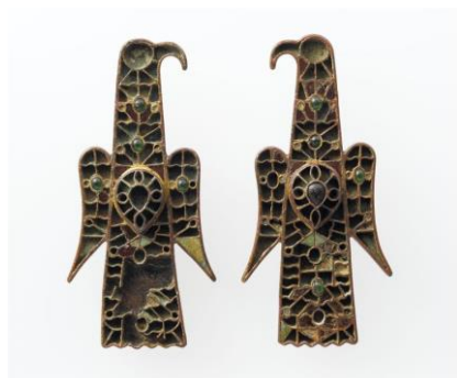
fibules du trésor de castelsagrat VI s

http://www.musee-moyenage.fr/collection/oeuvre/vitrail-de-saint-timothee.html