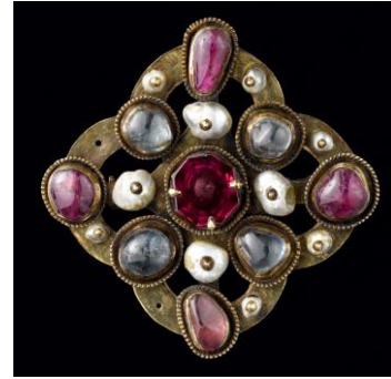
fermail du trésor de colmar XIII-XIV s

http://www.lesartsdecoratifs.fr/francais/musees/musee-des-arts-decoratifs/parcours/moyen-age-renaissance/une-chambre-a-coucher-a-la-fin-du-xve-siecle/pot-trompeur