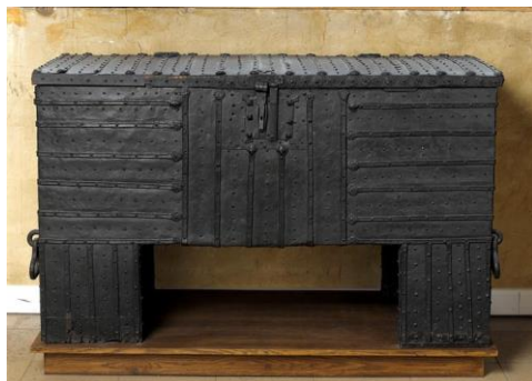
coffre-malle XIV s

http://www.musee-moyenage.fr/collection/oeuvre/la-dame-a-la-licorne.html