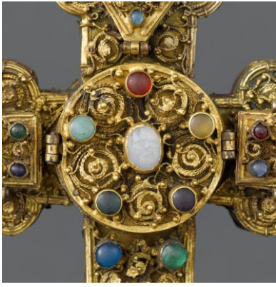
détail d'une croix reliquaire en cuivre doré et pierres précieuses XIII s

http://www.lesartsdecoratifs.fr/francais/musees/musee-des-arts-decoratifs/parcours/moyen-age-renaissance/une-chambre-a-coucher-a-la-fin-du-xve-siecle/pot-trompeur