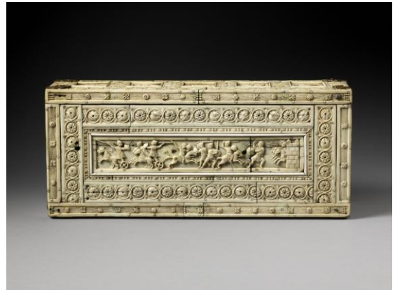
coffret en ivoire X s

http://www.inrap.fr/magazine/st-dizier/Des-pieces-remarquables/Les-fibules-ansees-asymetriques#undefined