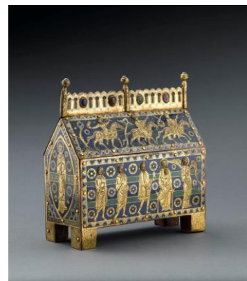
reliquaire en forme de chasse, cuivre émaillé XIII s

https://lesyeuxdargus.wordpress.com/2014/07/01/la-fibule-de-domagnano/