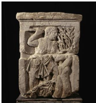
autel des nautes, calcaire 1er siècle

http://www.musee-moyenage.fr/collection/oeuvre/coffret-mythologie-combats.html