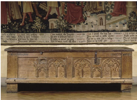
coffre de Poissy, bois XIII s

http://www.musee-moyenage.fr/collection/oeuvre/coffre-de-poissy.html