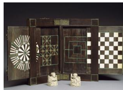
boîte de jeux

http://www.musee-moyenage.fr/collection/oeuvre/boite-a-jeux.html