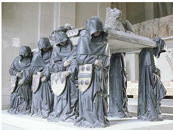
Tombeau de Philippe Pot, par Claus Sluter 1483

http://www.louvre.fr/oeuvre-notices/charles-iv-le-bel-mort-en-1328-et-jeanne-d-evreux-morte-en-1371-sa-femme-tenant-chacu https://www.altesses.eu/princes261.php