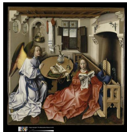
Panneau central du Triptyque de Mérode, par Robert Campin 1422-1430

http://www.bienpublic.com/grand-dijon/2013/09/06/portrait-du-duc-philippe-le-bon http://mba.dijon.fr/sites/default/files/Collections/pdf/les_portraits_des_ducs_de_bourgogne.pdf