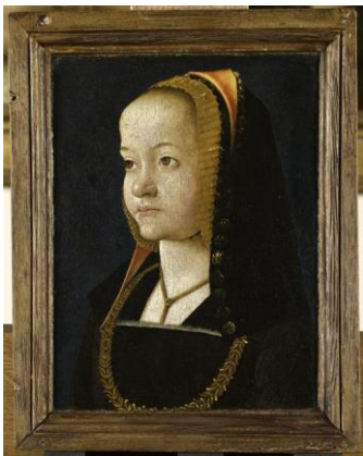
Portrait par Jean Perréal 1493