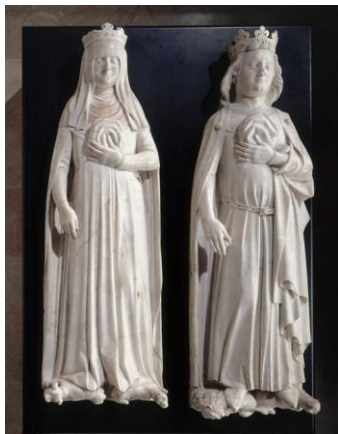
gisants de Charles IV et de Jeanne d'Evreux, par Jean de Liège 1372

http://cathedrale-amiens.monuments-nationaux.fr/fr/ http://whc.unesco.org/fr/list/162/