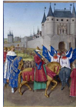
Manuscrit enluminé : les grandes chroniques de France par Jean Fouquet

http://expositions.bnf.fr/fouquet/grand/f145.htm http://patrimoine.iledefrance.fr/sites/default/files/medias/2015/02/etienne_chevalier.pdf