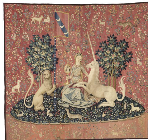
Tapisserie de la dame à la licorne vers 1495

http://gallica.bnf.fr/ark:/12148/btv1b84525476/f295 http://expositions.bnf.fr/fouquet/enimages/chroniques/intro.htm