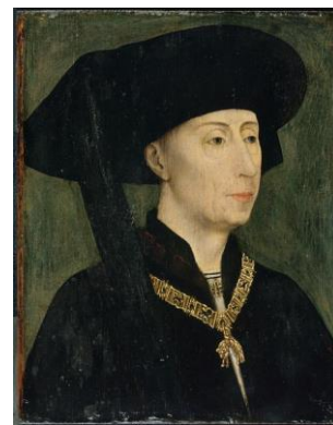
Portrait du duc de Bourgogne Philippe III le bon par Rogier van der Weyden

http://www.louvre.fr/oeuvre-notices/jean-ii-le-bon-roi-de-france-