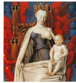
Diptyque de Melun par Jean Fouquet vers 1455

http://expositions.bnf.fr/fouquet/grand/f145.htm http://patrimoine.iledefrance.fr/sites/default/files/medias/2015/02/etienne_chevalier.pdf