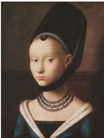
Portrait par Pétrus Christus 1470