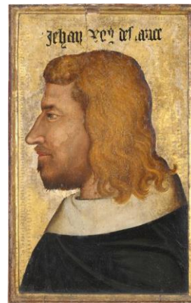
Portrait du roi de France, Jean II le bon 1355

http://www.louvre.fr/oeuvre-notices/tombeau-de-philippe-pot-1428-1493-grand-senechal-de-bourgogne