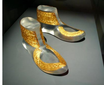
Trésor de Hochdorf (décoration de sandales en or), VI s av jc, keltunmuseum

http://www.britishmuseum.org/research/collection_online/collection_object_details.aspx?objectId=1362722&partId=1