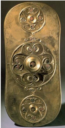
bouclier de Battersea, 1er s. av jc , bronze, or, émail rouge (british museum )

http://www.britishmuseum.org/explore/highlights/highlight_objects/pe/prb/t/the_mold_gold_cape.aspx