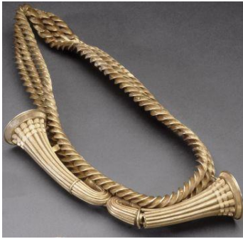
trésor de Guines

http://www.pourlascience.fr/ewb_pages/a/article-le-disque-de-nebra-un-calendrier-agricole-21635.php