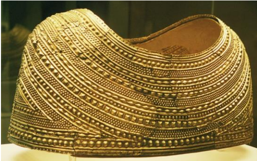
Pectoral de Mold vers – 1700 av jc , or (british museum)

http://www.britishmuseum.org/explore/highlights/highlight_objects/pe/prb/t/the_mold_gold_cape.aspx