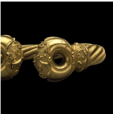
torque de Snettisham, or, 1er s. av jc (british museum)

http://arts-celtiques.e-monsite.com/album/armement/bouclier-de-battersea.html