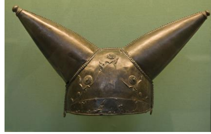
Casque de Waterloo, 2 e - 1 er siècle avant jc, alliage cuivreux, british museum

http://www.britishmuseum.org/explore/highlights/highlight_objects/pe/prb/t/the_great_torc_from_snettisham.aspx