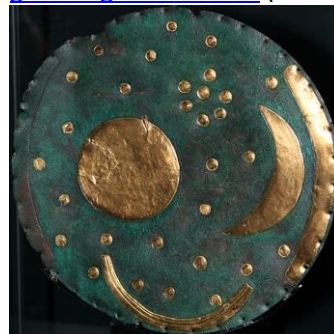
disque de Nébra, bronze et or, - 1600 ans av jc,

http://www.dailymotion.com/video/xwqwyi_druides-et-regents-les-princes-celtes-de-glauberg_school http://www.waa.ox.ac.uk/XDB/tours/europe4.asp https://couloirdunet.wordpress.com/civilisation/les-celtes/les-princes-celtes/ http://www.mystere-tv.com/le-prince-celte-du-glauberg-v1716.html (vidéo)