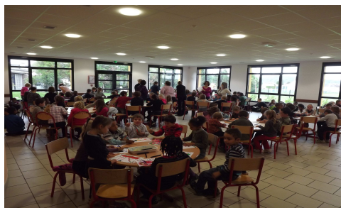
Exercice de confinement PPMS du 10/10/2013

Bulletin Municipal d'informations de la commune de Courcelles sur Seine