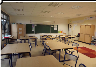
Ouverture de la 6ème classe