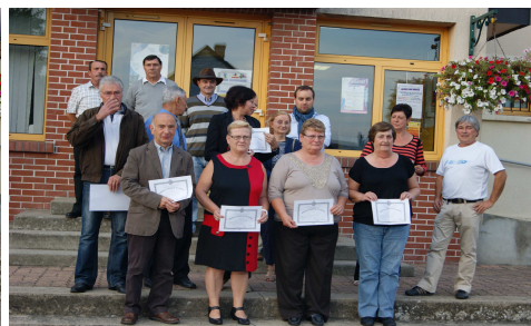
Médailles du travail le 27/09/2013