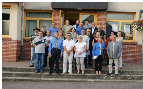
Maisons et Commerces fleuris le 27/09/2013