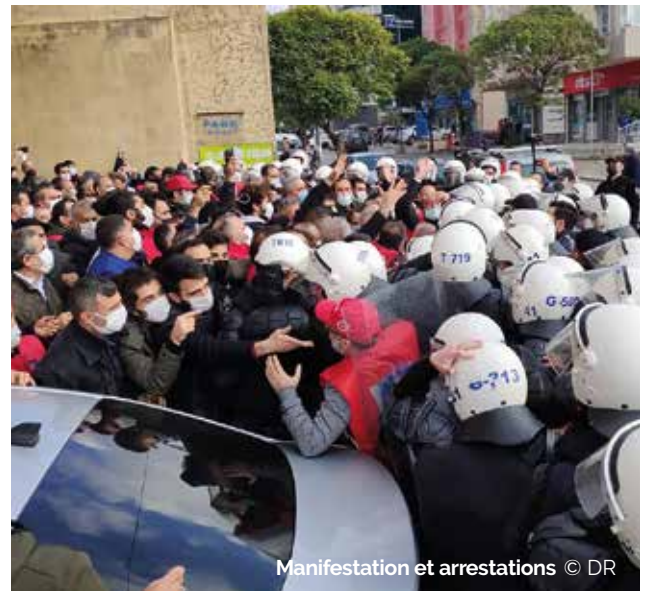
Manifestation et arrestations