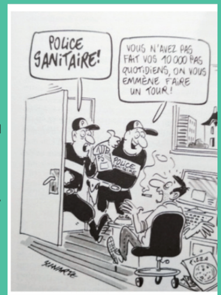
Dessin de SCHWARTS, «La santé publique en question(s)» - Laurent CHAMBAUD

Si vous n'en avez pas, on vous prête un podomètre !