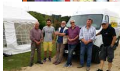
Les bénévoles pour le montage du camp d'été