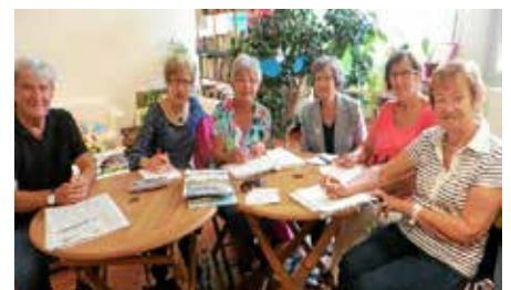
L'équipe dynamique de l'association Le Temps des Loisirs