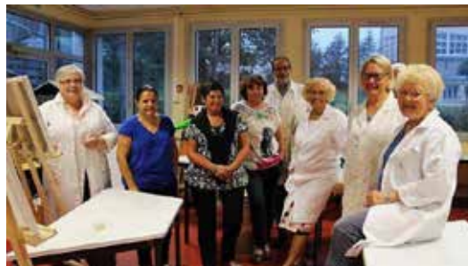
Atelier des peintres