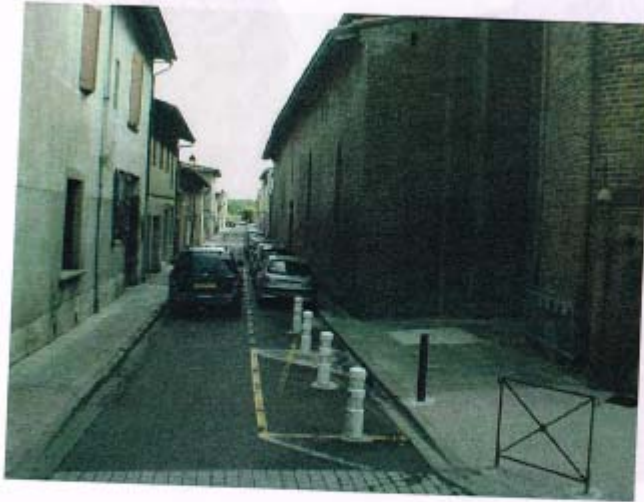
Photo 1 : Rue de l'égalité, depuis la rue Gambetta : Trottoirs non accessibles, un espace dominé par la voiture