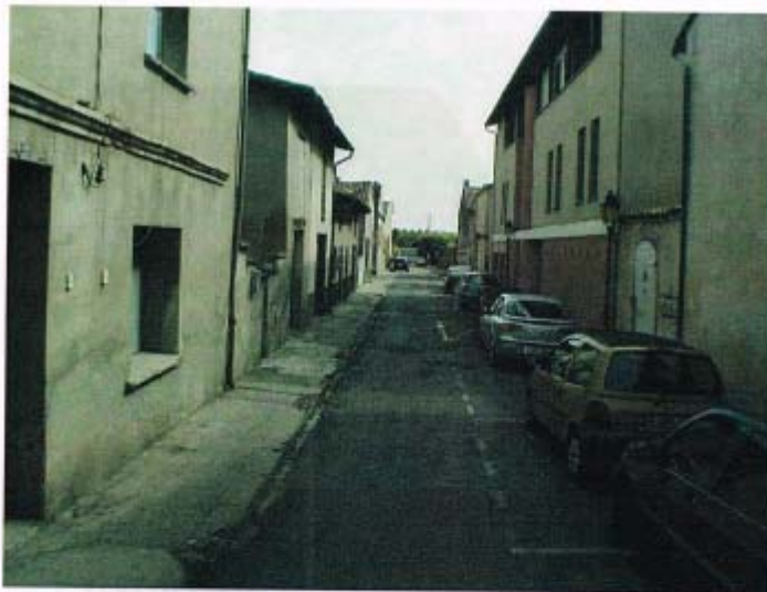
Photo 2 : Rue de l'égalité, depuis la rue Victor Hugo Chaussée étroite et trottoir dégradé du fait de la circulation des véhicules