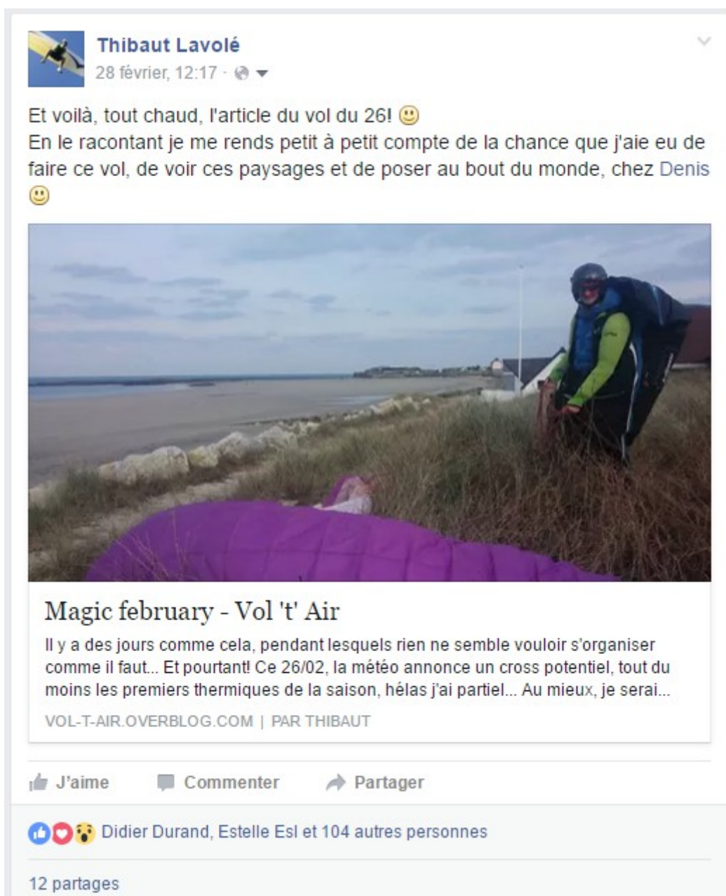
Statut Facebook pour la publication d'un récit de vol

Je dispose de plusieurs supports de communication et je ne manquerai pas une occasion de mettre en avant ceux qui me supportent. Que ce soit sur un post, sur une page entière et sur chaque article de mon blog, dans la presse spécialisée ou locale, ou encore sur le site de live-tracking, chaque publication sera associée à votre image.