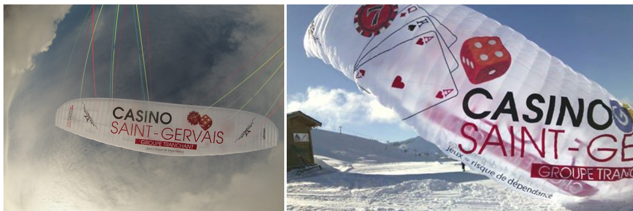
Exemple de flocages réalisés pour un casino du groupe Tranchant

Grâce à son côté atypique et extraordinaire, le parapente attire toujours le regard des gens, et les piétons qui se baladent sur la côte sont toujours émerveillés de nous voir évoluer dans le ciel. De ce fait, mon aile d'une surface de 24m 2 , est un support idéal de communication.