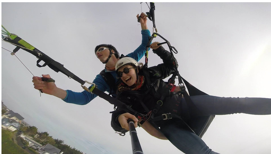
Un vol bi-place acrobatique avec ma petite amie, sensations garanties

Qualifié pour l'emport de passagers depuis 2012, j'ai déjà fait découvrir le plaisir de voler au contact de la masse d'air à de nombreuses personnes. Fort de cette expérience, je vous propose des bons pour des vols en bi-place, en Suisse-Normande ou sur la côte, accompagné d'une vidéo souvenir. (Valeur unitaire minimum : 80€)