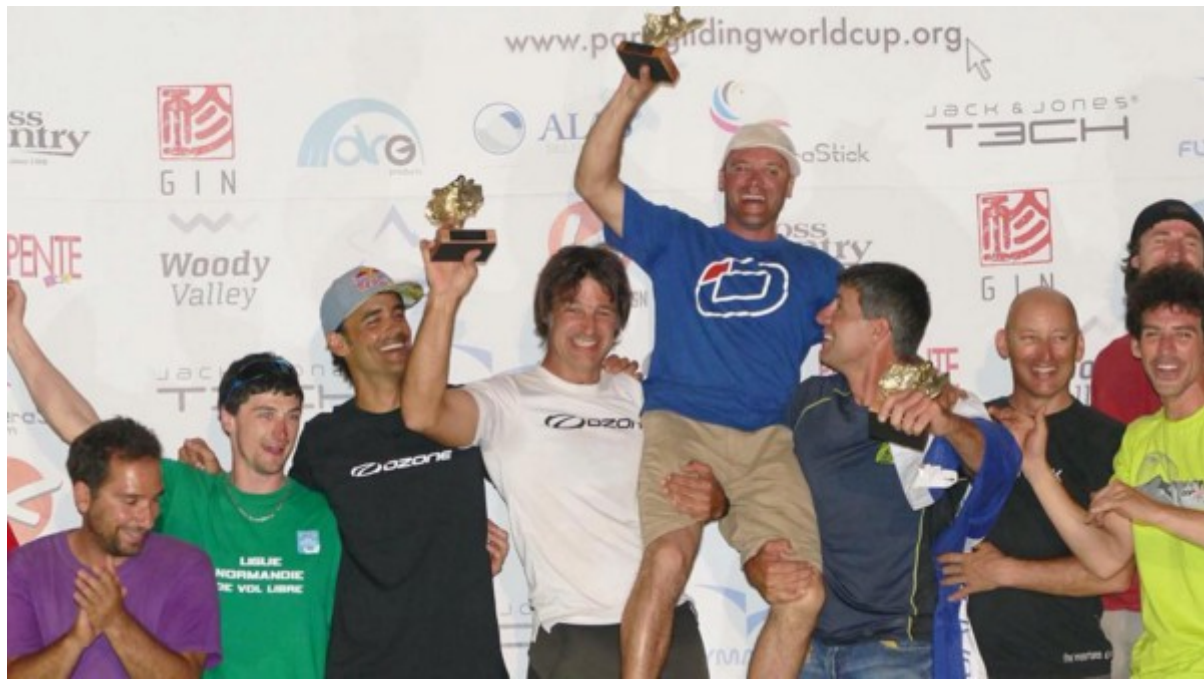
Coupe du Monde de Castelo - Brésil - 6 ème