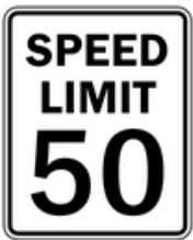
Vitesse limitée à 50 MPH

Surveillez les autobus jaunes de ramassage scolaire. En s'arrêtant pour laisser monter ou descendre un enfant, ils déploient un panneau "stop" et font clignoter leurs feux. L'arrêt complet est obligatoire : Pas question de doubler !