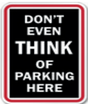
Ne pensez même pas à vous garer ici