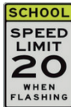
Ecole : vitesse limitée quand le feu clignote