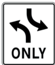
Tournez l'un devant l'autre