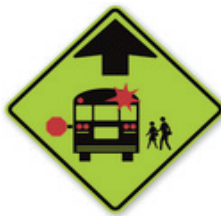
Priorité au bus