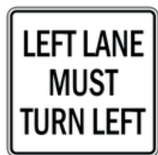
Les véhicules sur la voie de gauche doivent tourner à gauche