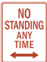
Arrêt interdit à toute heure