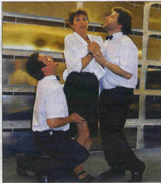
Les superbes comédiens de la Compagnie Casus Délire, ont offert un repas insolite à leurs nombreux convives.

Proposé par le Quartier, le Théâtre de Cornouaille, la Médiathèque des Ursulines, Artem, l'Ecole des Beaux-Arts et Gros Plan, « Entre Chien et Loup » a rassemblé, samedi soir, un grand nombre de spectateurs.