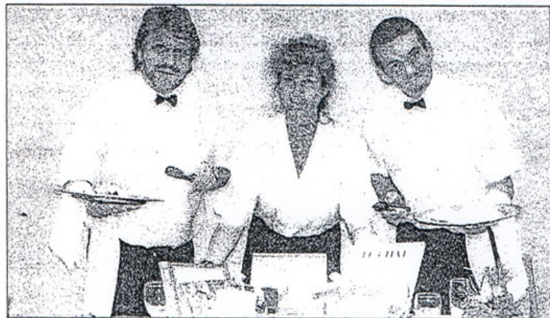
Les trois comédiens de la troupe Casus Délires mettent les petits plats dans les grands.

On ne sait pas encore si le spectacle « Esprit gourmet » fera recette mais il met l'eau à la bouche. L'après-midi du 17 octobre, la médiathèque se transformera en brasserie et restaurant.