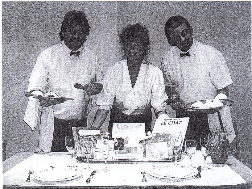
Mots et mets, verres et vers, livres aux lèvres, bienvenue à la restaura-thèque L'Esprit Gourmet.

La salle des contes prendra, elle, l'allure d'une salle de restaurant, où se tiendra la deuxième partie du spectacle. Invité à prendre place autour de quelques tables finement dressées, le public se verra proposer par les comédiens, au cours d'un service impeccablement loufoque, un menu « prestige » composé des « meilleurs morceaux de la littérature romanesque,