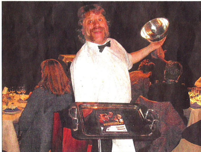
« Et pour débiter, quelques bulles de langues de chat qui font Geluck, Geluck ! »

Quand la médiathèque fait venir la « restauthèque », à la Maison des Arts, c'est tout un menu, mais aussi tout un art !