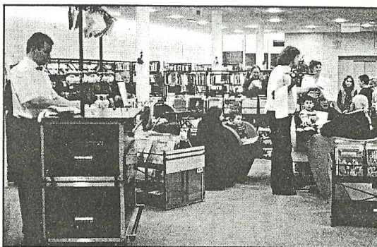
Les « serveurs » très attentifs à leurs « clients »

Les 3 comédiens nous ont concocté deux menus savoureux. D'abord, en fin d'après-midi dans un esprit brasserie, puis le soir venu dans une ambiance plus feutrée d'un grand restaurant.