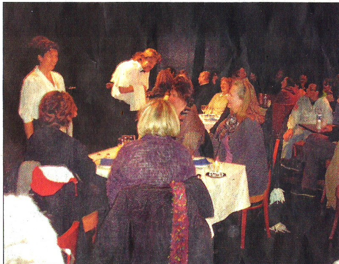
Les comédiens ont servi de délicieux mets littéraires.

Dans le théâtre transformé en cabaret, les comédiens ont proposé un superbe menu à commencer par les