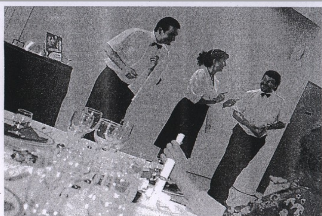
Humour décalé avec la compagnie Casus Délires et sa restauthèque. Un menu délirant attendait le public attablé à la médiathèque.

Deux services étaient proposés avec au menu, de délicieux mélanges littéraires et quelques charcuteries, des extraits servis dans des verres à pied, quelques mots rares sur de belles tartines, des salades, des farces et autres fantaisies. Le tout, arrosé de jus de fruit, cidre ou poiré. Une soirée mijotée aux petits oignons qui a ravi la trentaine de personnes : « Surprenant, original, amusant, sympathique... », pouvait-on entendre. La semaine prochaine mercredi et samedi, des projections gourmandes seront au menu de la médiathèque.