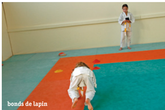
bonds de lapin