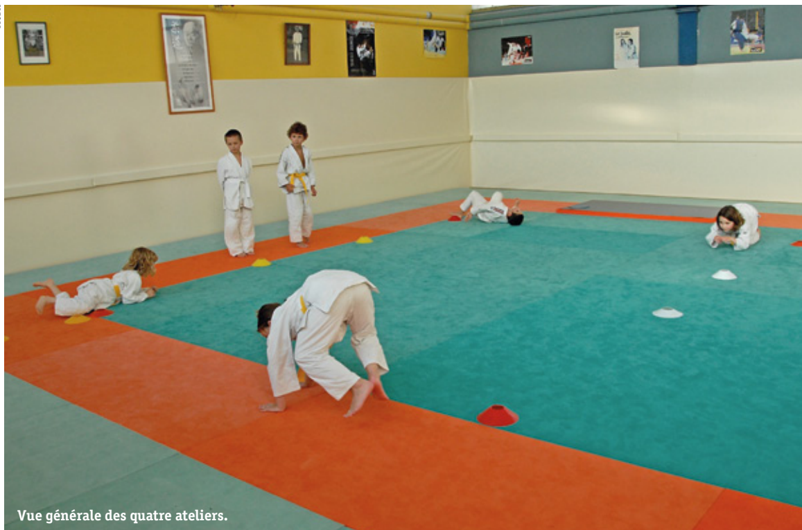
Vue générale des quatre ateliers.