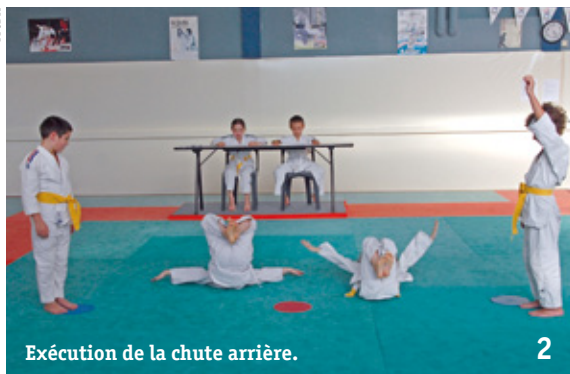
Exécution de la chute arrière.

Note maximale : 10 points / Note minimale : 5 points