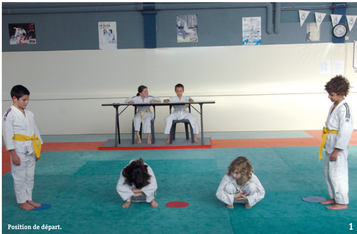
Position de départ.