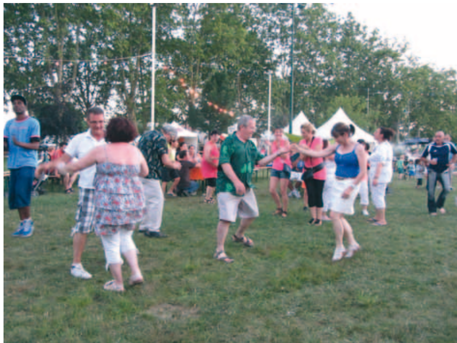
Les heureux participants de la 5 e édition de Bacalafiesta ont dansé tout leur soûl lors des deux soirées de fiesta en bord de Garonne.

Avez-vous eu la chance de vous initier à la danse orientale avant de déguster le couscous ? Les cinq danseuses de l'association « Ausatinrouge » ont pu faire voyager les habitants, avec leurs jolis déhanchés, et même initier celles et ceux qui le souhaitaient.