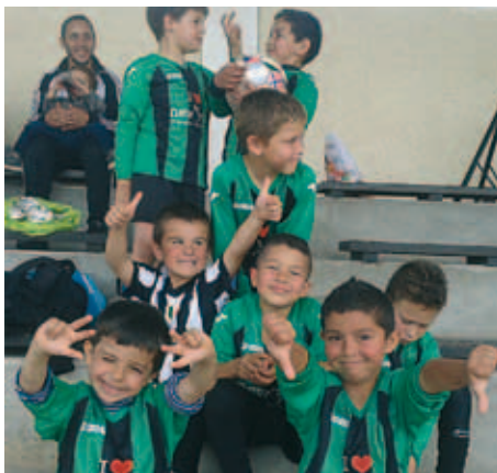
Les copains du foot au tournoi de Bruges

Contact : 06 20 23 47 10 club.bordeauxathletic@sfr.fr