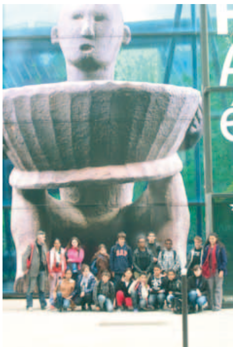
École ouverte des vacances de Printemps menée par le collège Blanqui et l'Amicale Laïque de Bacalan.