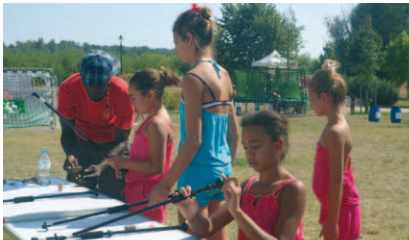
C'est reparti pour Bacalaventure le samedi 14 septembre

17 oct.-3 nov. : 4 e édition du Curiositarium . Scénographie thème « Cirque freaks », avec l'école de cirque, performances burlesques et concerts.