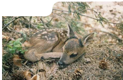
Les nouveaux-nés sont vulnérables face aux chiens sans surveillance