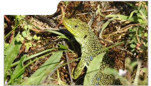
Le lézard ocellé, redécouvert en 2017 dans la région, est une proie facile pour les chiens non surveillés

Les animaux de compagnie peuvent perturber la faune sauvage, notamment pendant la période de reproduction et la saison des naissances. Des constats alarmants de destructions de terriers notamment sur le littoral vendéen invitent à nouveau l'ONF à rappeler quelques règles importantes et pourtant simples à appliquer. Le respect de ces dernières permet à tous de contribuer à la préservation des milieux fragiles que représentent les forêts et les dunes.