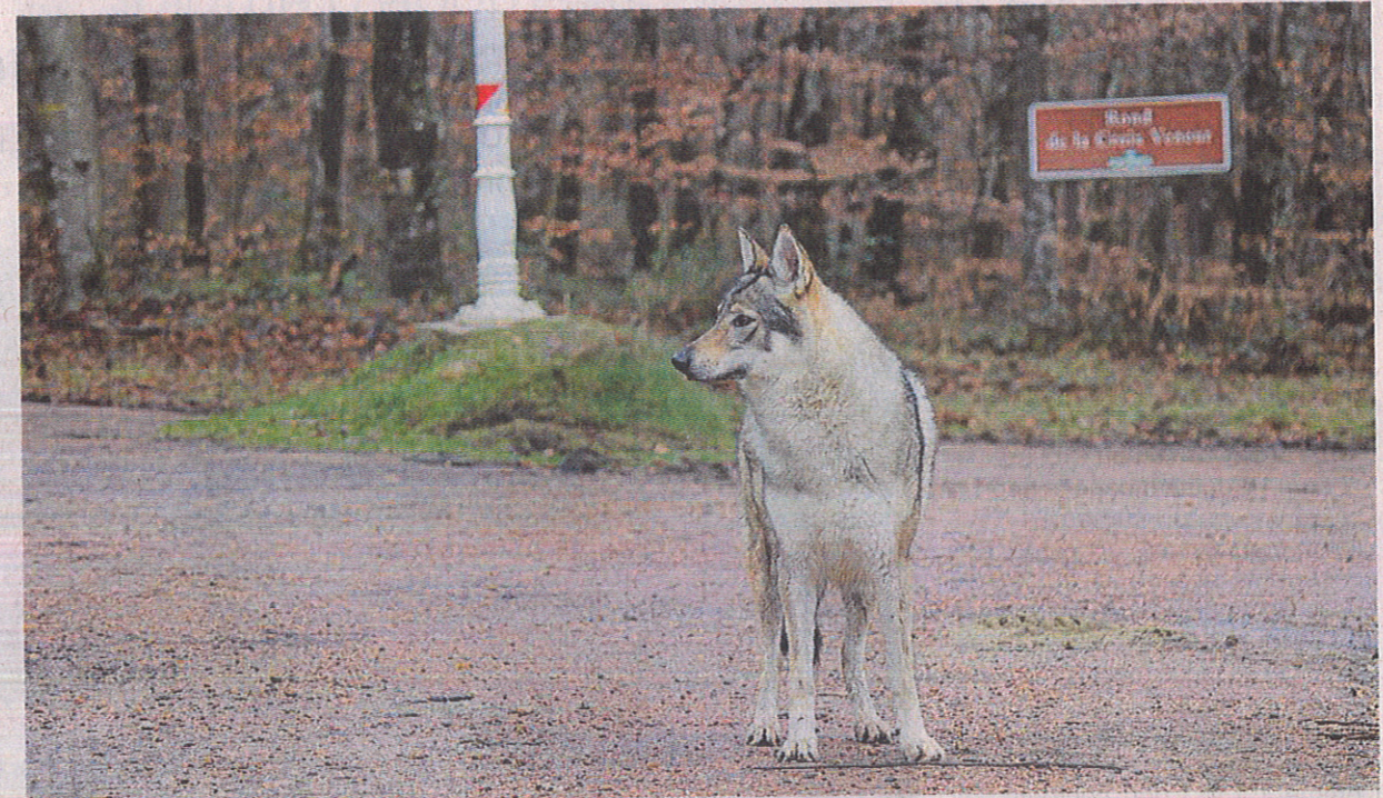
On peut croiser ce chien-loup tchèque en forêt de Bercé, accompagné de son maître (lire ci-dessous).

Le loup tant décrié ne méritait pas la réputation qu'on lui faisait. Dangereux s'il était enragé, c'est la rage qu'il fallait combattre, non l'animal. Au XIX e siècle, le loup a-t-il sa place dans les forêts sarthoises ? La parole est aux experts.